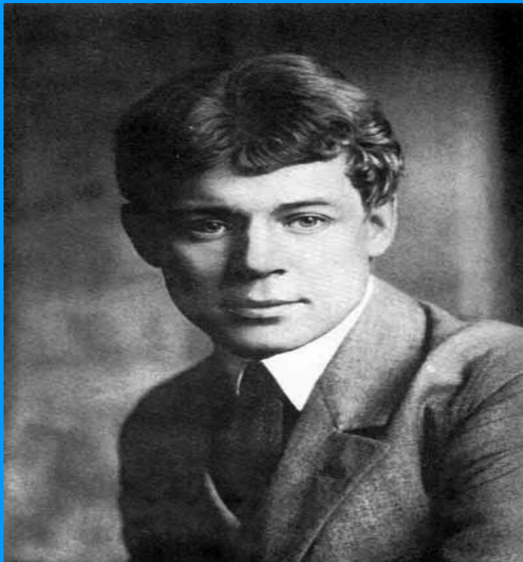
Портрет С. Есенина