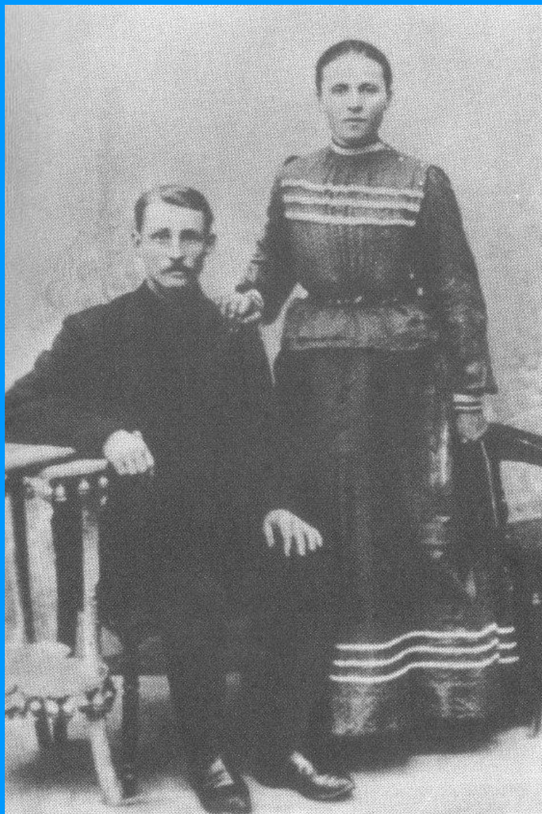
Родители поэта - потомственные рязанские хлеборобы