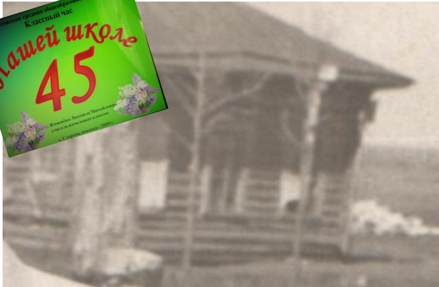
Начальная школа с. Старомалиновка