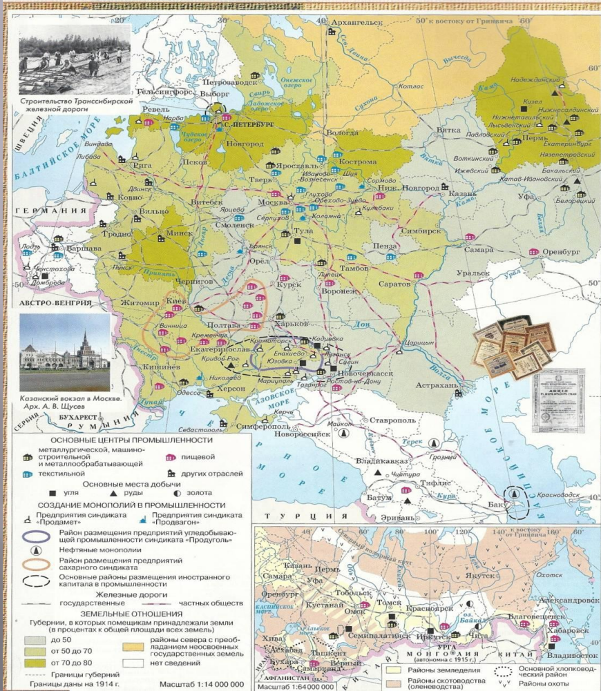
Экономическое развитие России в начале XX в.