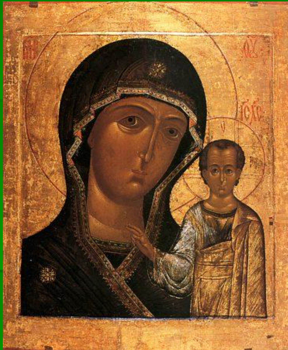
Икона Казанской Божьей Матери.