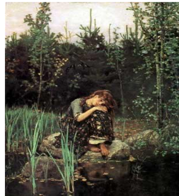
«Алёнушка» 1881 г.