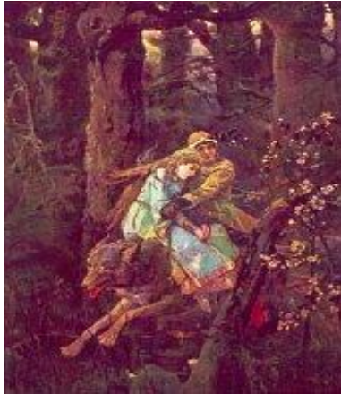
«Иван-царевич на сером волке» 1889 г.