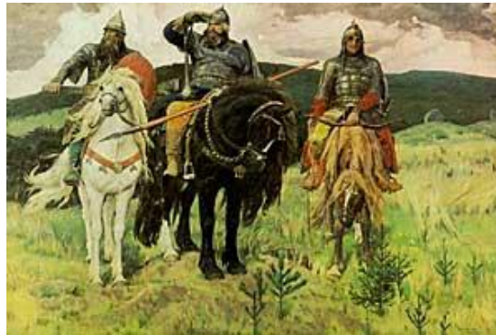
«Богатыри» 1898 г.