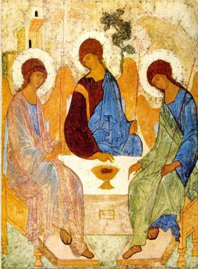
Икона «Троица». Андрей Рублев

Иконы ветхозаветных святых, в основном предков Христа, в том числе первых людей — Адама, Евы, Авеля. Центральная икона ряда — «Отечество» или «Троица Новозаветная». В некоторых современных иконостасах центральным образом праотеческого ряда сделана икона «Троица Ветхозаветная», то есть изображение явления трех Ангелов Аврааму.