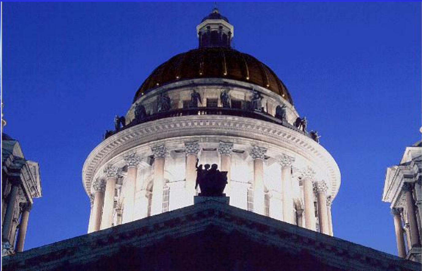
Купол Исаакиевского собора