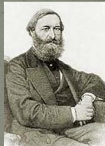
Юрий Федорович Самарин