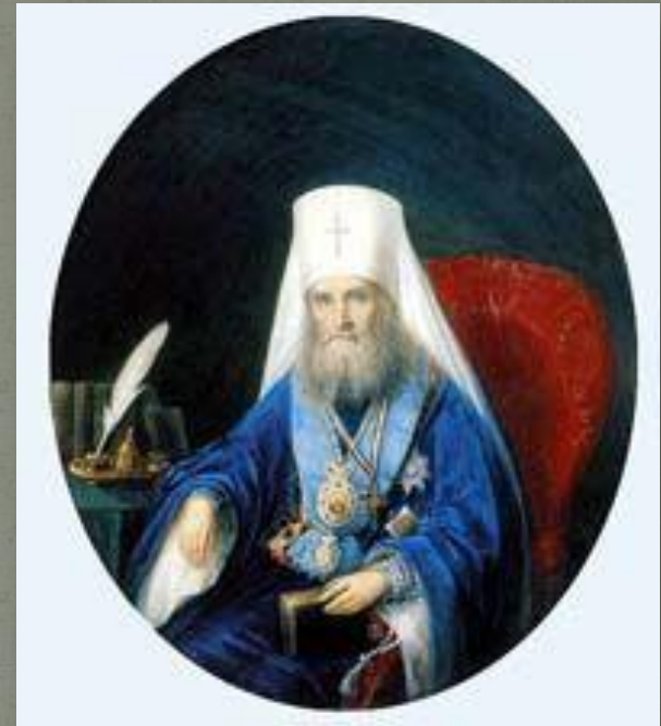
Митрополит Филарет (Дроздов) по просьбе царя написал текст Манифеста 19 февраля 1861г.