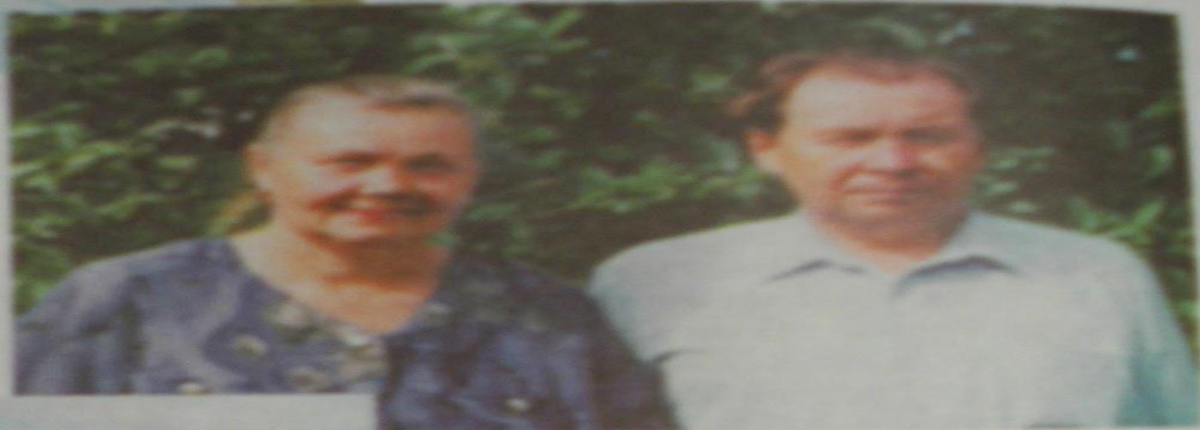
Хатыны Сәйдәнүр әнәшәсендә