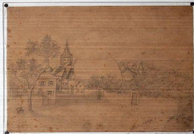
Рисунки Вити Коробкова.