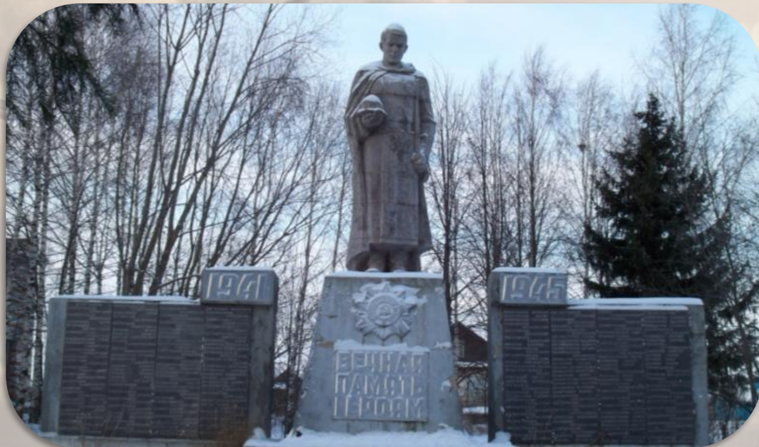
Памятник односельчанам, погибшим в Великой Отечественной войне д. Тат-Китня