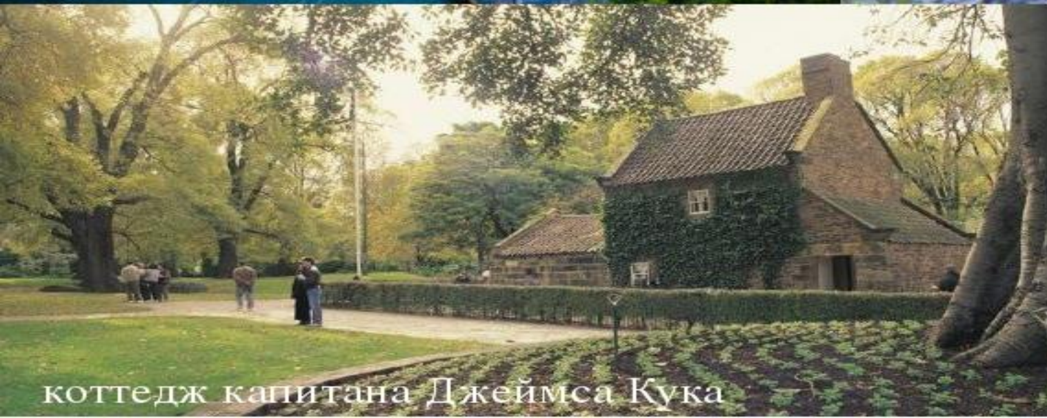
коттедж капитана Джеймса Кука