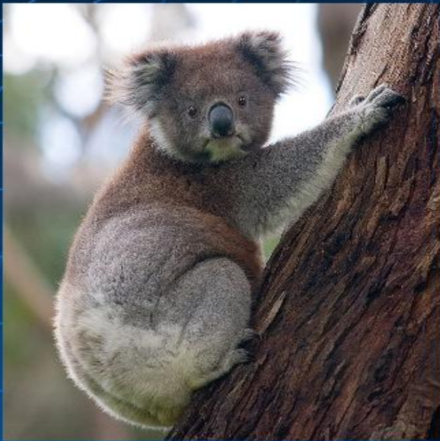
Коала на стволе эвкалипта, листьями которого питается этот эндемик Австралии