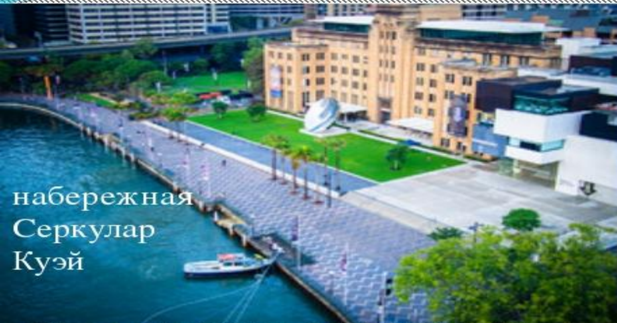
набережная Серкулар Куэй