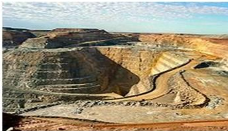
«Биг Пит» («Большая яма»), золотой рудник у Калгурли