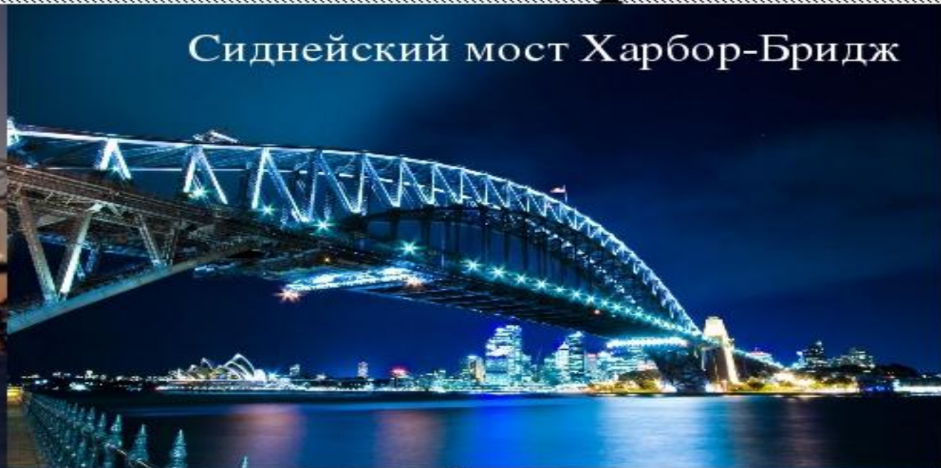
Сиднейский мост Харбор-Бридж