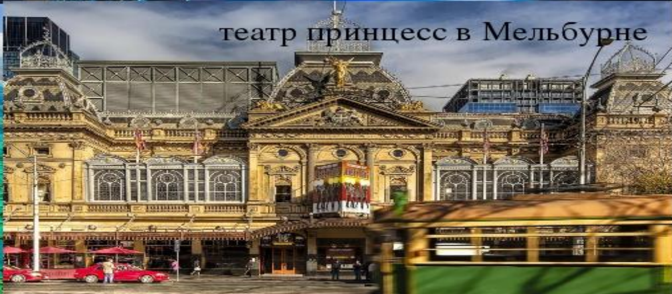
театр принцесс в Мельбурне