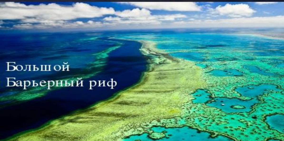
Большой Барьерный риф