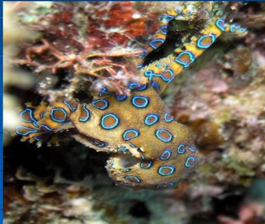
Укус синекольчатого осьминога смертелен