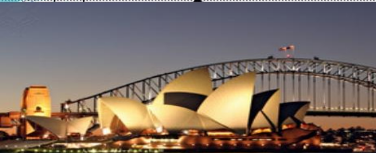
Оперный театр в Сиднее