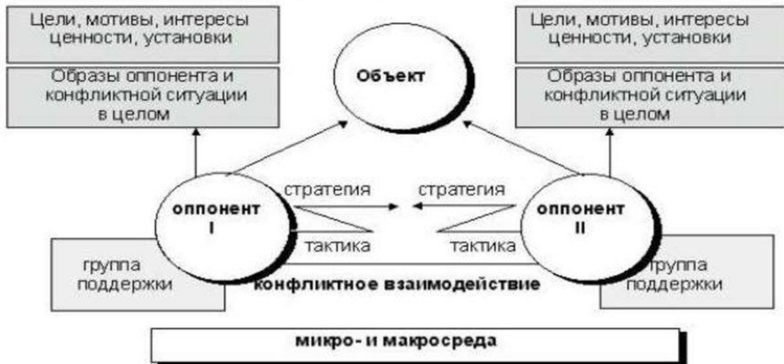
Структура конфликтной ситуации