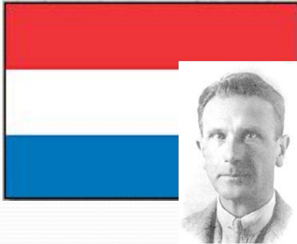
И. ван Лохем в 20-е годы

Рационализм, экономичные решения, высокое качество, конструктивная и стилистическая новизна отличали работу Ван Лохема .