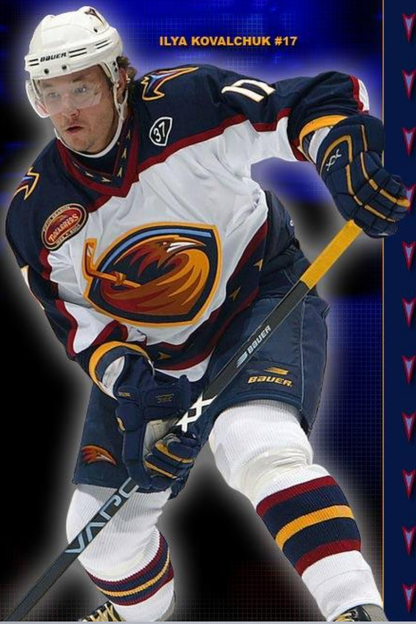
ILYA KOVALCHUK #17