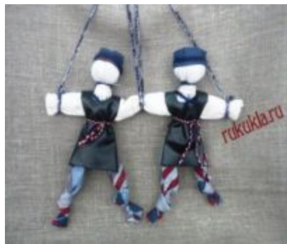
Козьма и демьян