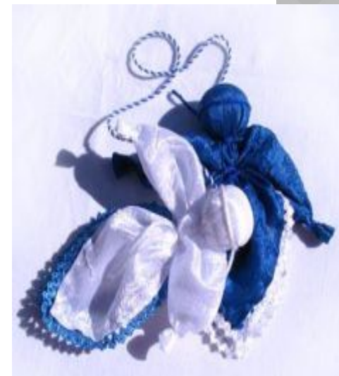
День и ночь