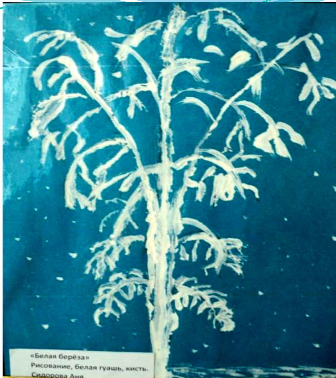
«Белая берёза» Рисование, белая гуашь, кисть. Сидорова Аня

Сидорова Аня, 5 лет, ДОУ №12 «Белая берёза». Рисование, гуашь.