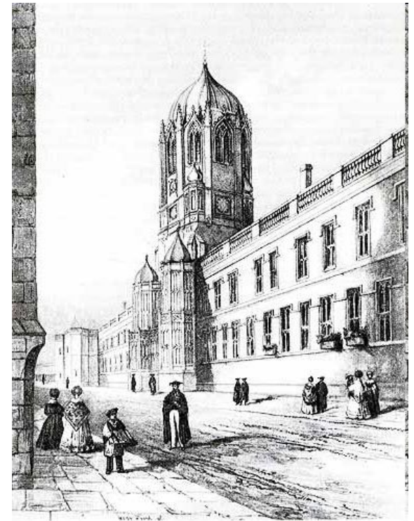
Вид на Крайст Чёрч Колледж. Гравюра середины 19 век