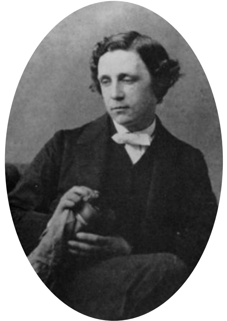
ЛЬЮИС КЭРРОЛЛ (ЧАРЛЗ ЛЮТВИДЖ ДОДЖСОН) 1832 - 1898