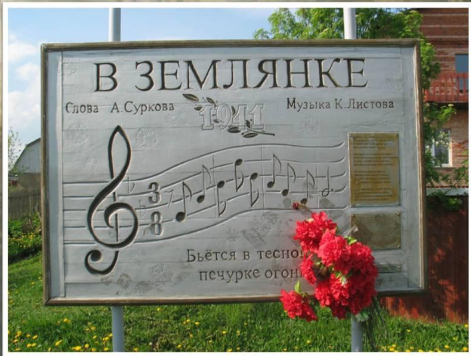
Место рождения песни. Деревня Кашино.