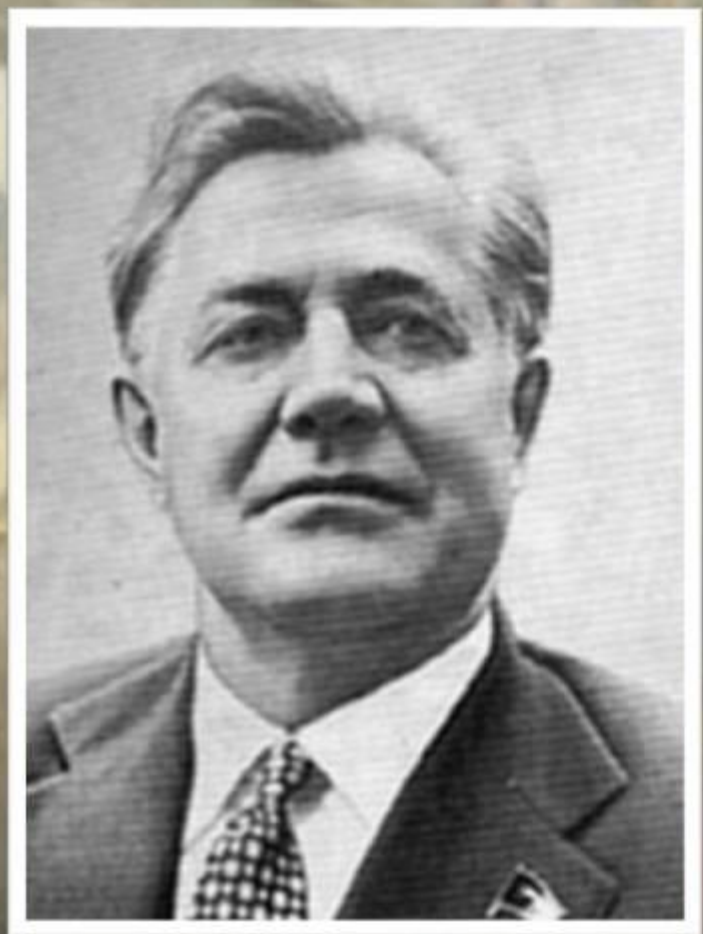
Алексей Александрович Сурков