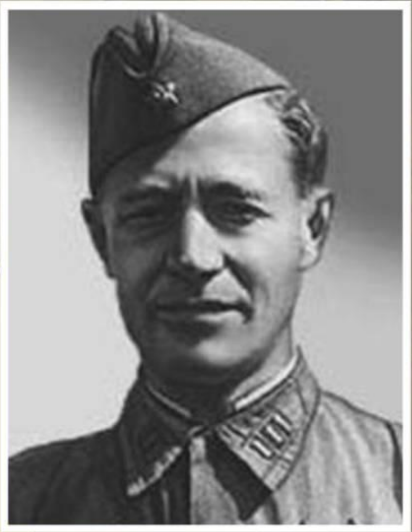
А. А. Сурков