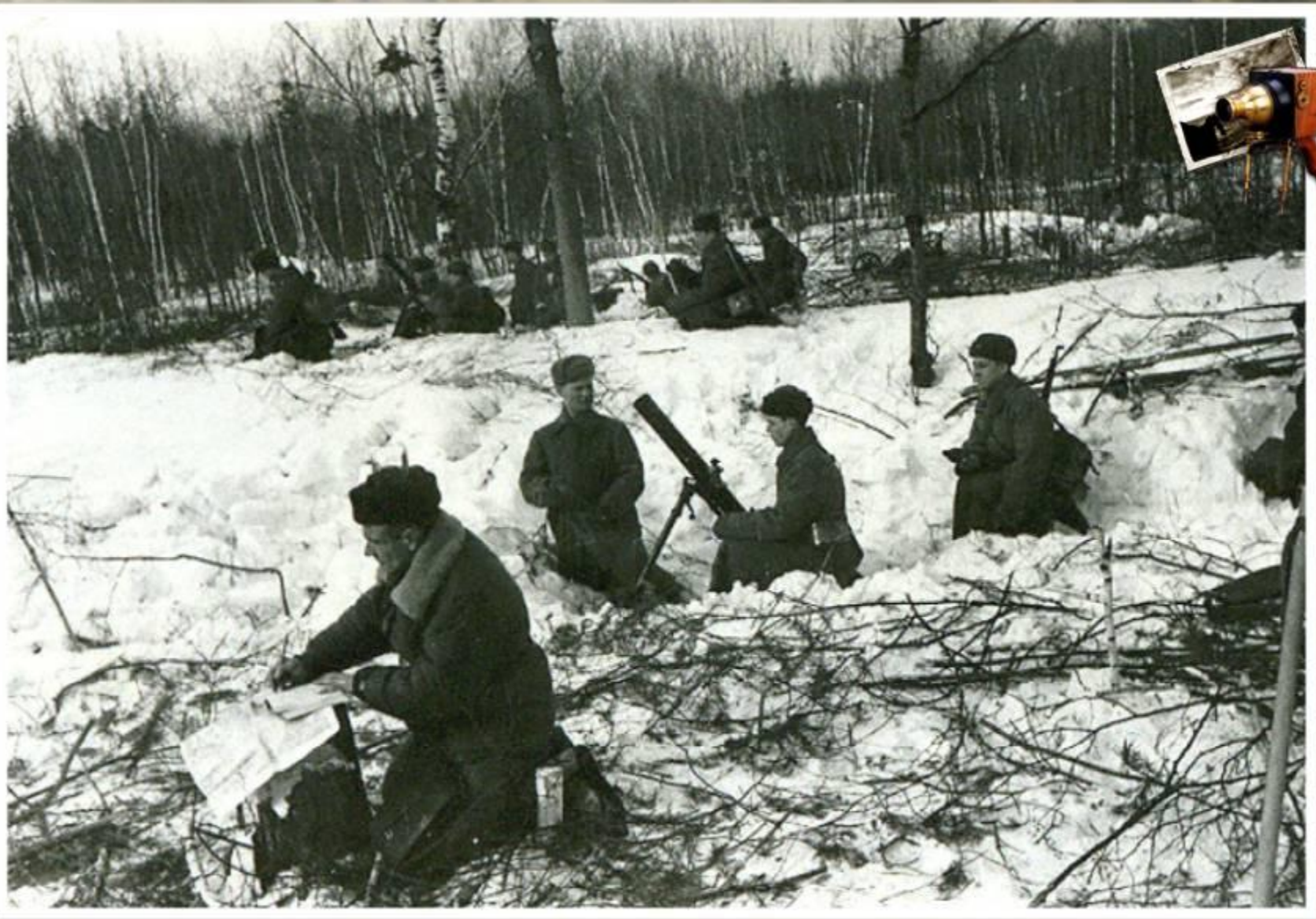
На подступах к Москве. 1941 год.