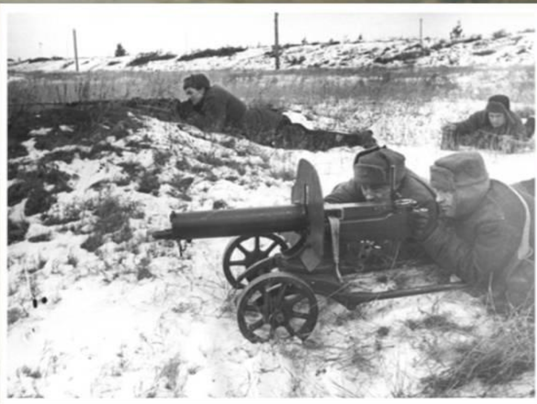
На подступах к Москве. 1941 год.