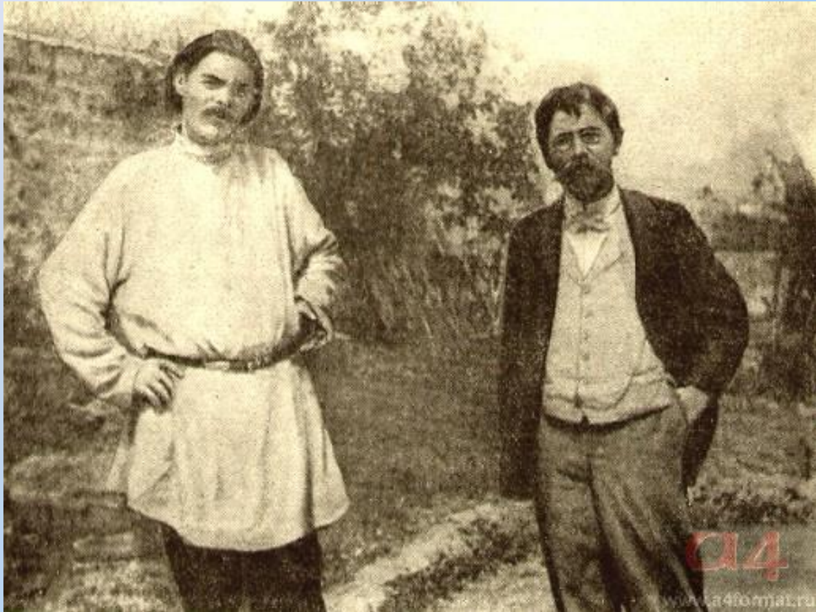
А. П. Чехов и М. Горький в саду на даче Чехова в Ялте.