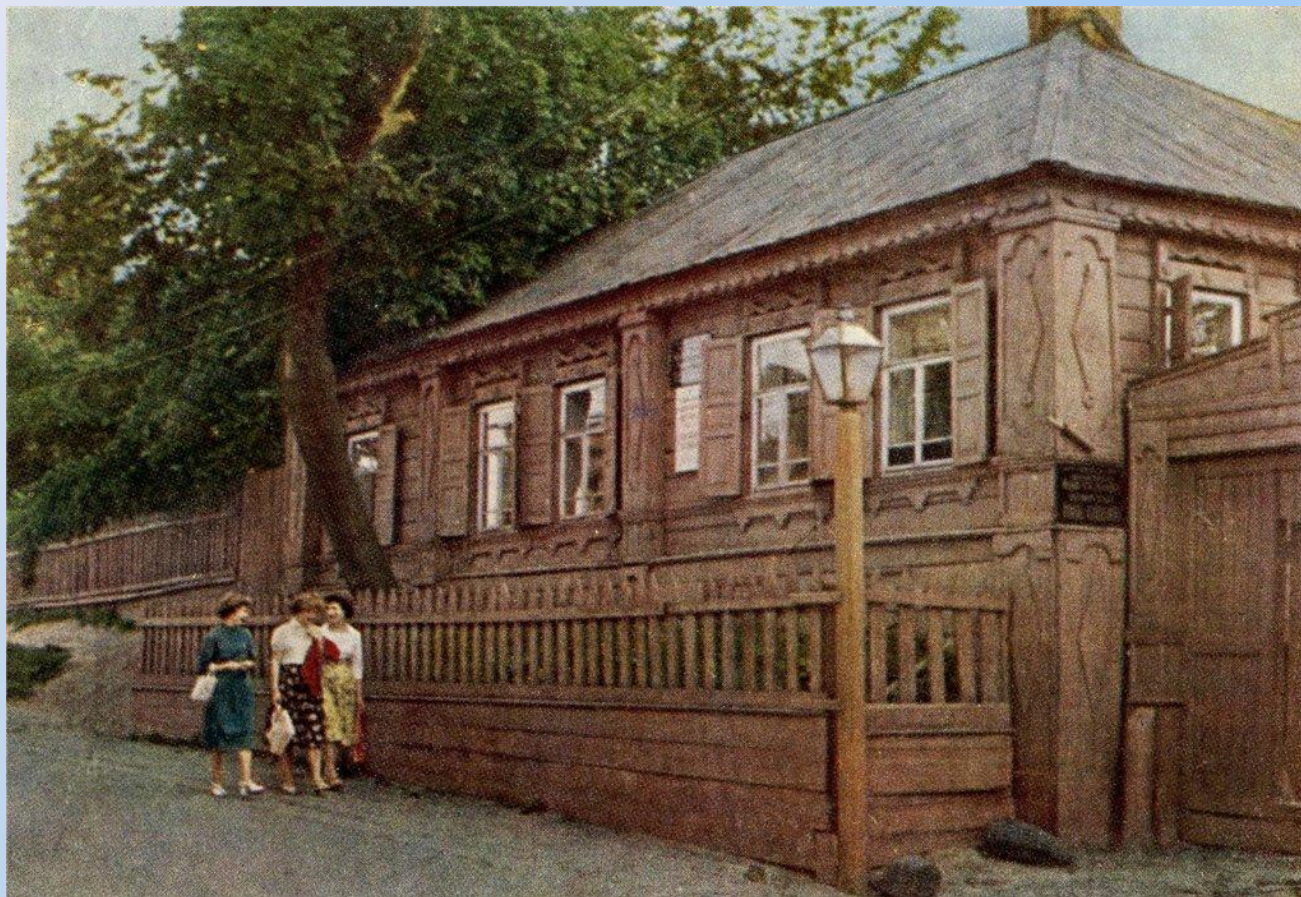
Домик Каширина, где провел детство А. М. Горький.