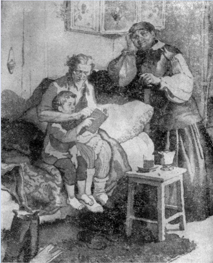
С рисунка Б. А. Дехтерева.

Родился 16 (28) марта 1868 года в г. Нижний Новгород в небогатой семье столяра.