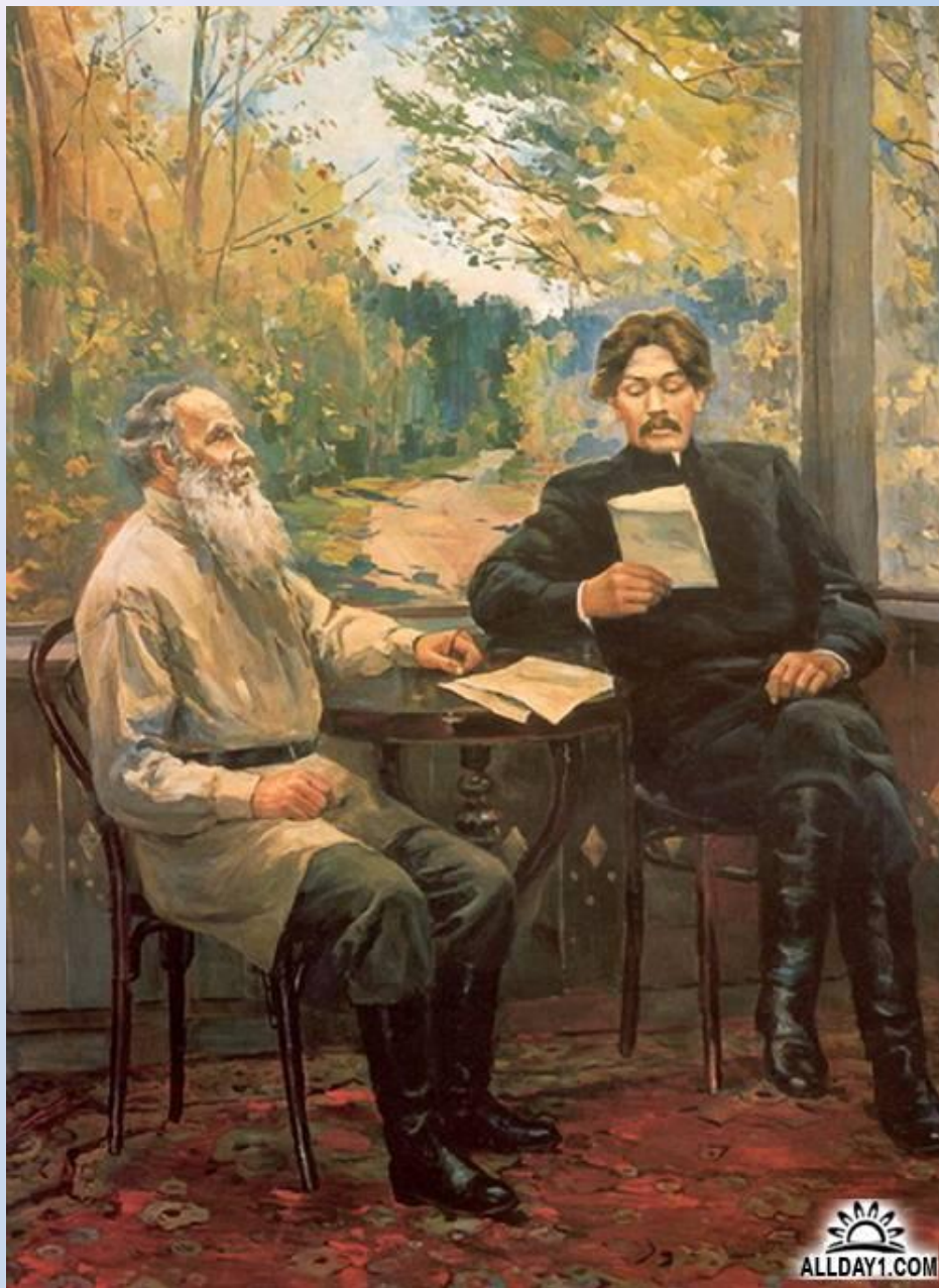
А.М.Горький и Л.Н. Толстой в Ясной поляне.