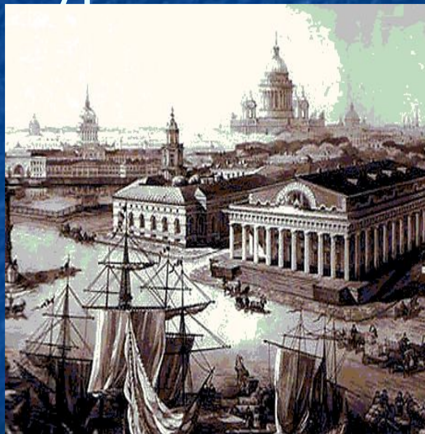
Стрелка Васильевского острова