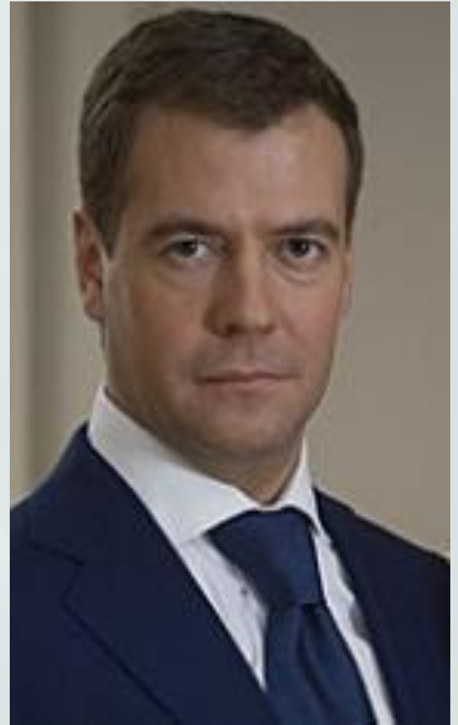
Д. А. Медведев

Главная задача современной школы, - это раскрытие способностей каждого ученика, воспитание личности, готовой к жизни в высокотехнологичном, конкурентном мире. ... Школьное обучение должно способствовать личностному росту так, чтобы выпускники могли самостоятельно ставить и достигать серьезные цели, уметь реагировать на разные жизненные ситуации