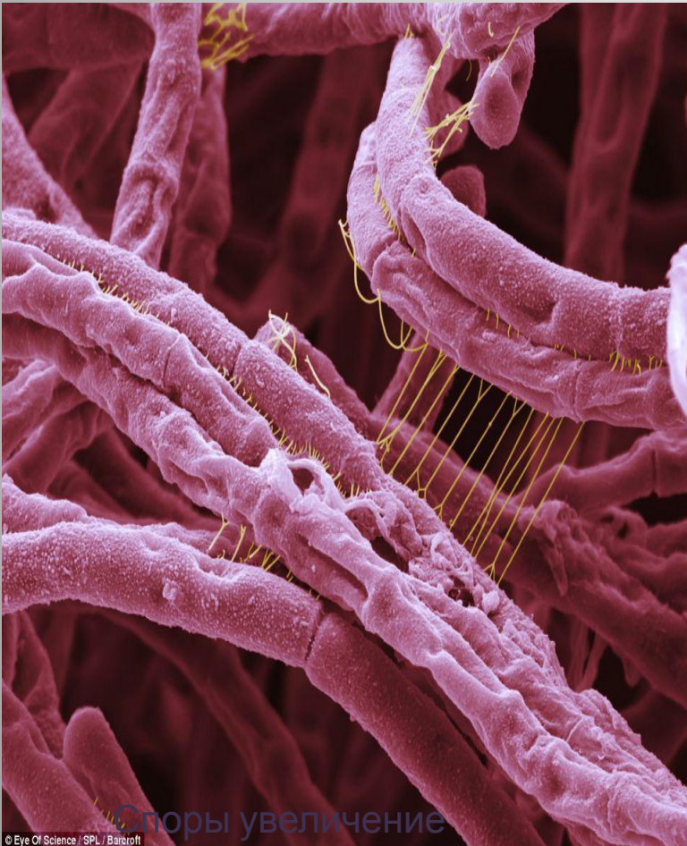
Споры увеличение x18,300