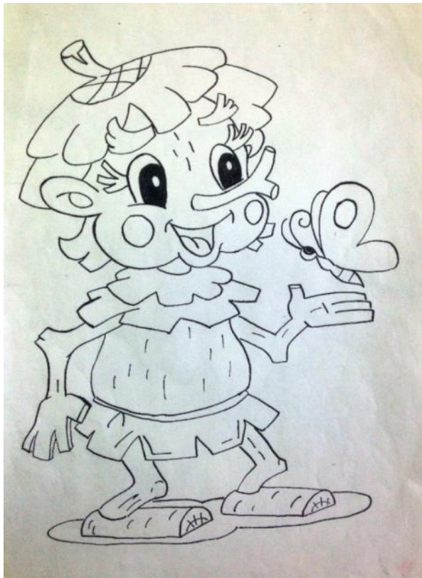
Рисунок лучше выбрать покрупнее, т.к. мелкие детали заполняются сложнее. В дальнейшем композиции можно усложнить.

Для начала можно использовать различные раскраски.