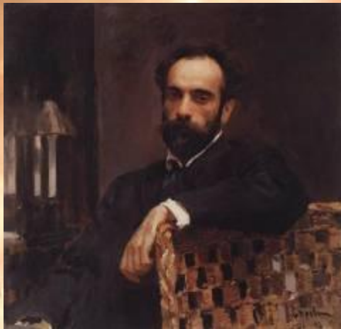
Исаак Ильич Левитан (1860-1900 г.г.)