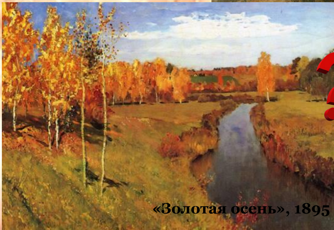
«Золотая осень», 1895