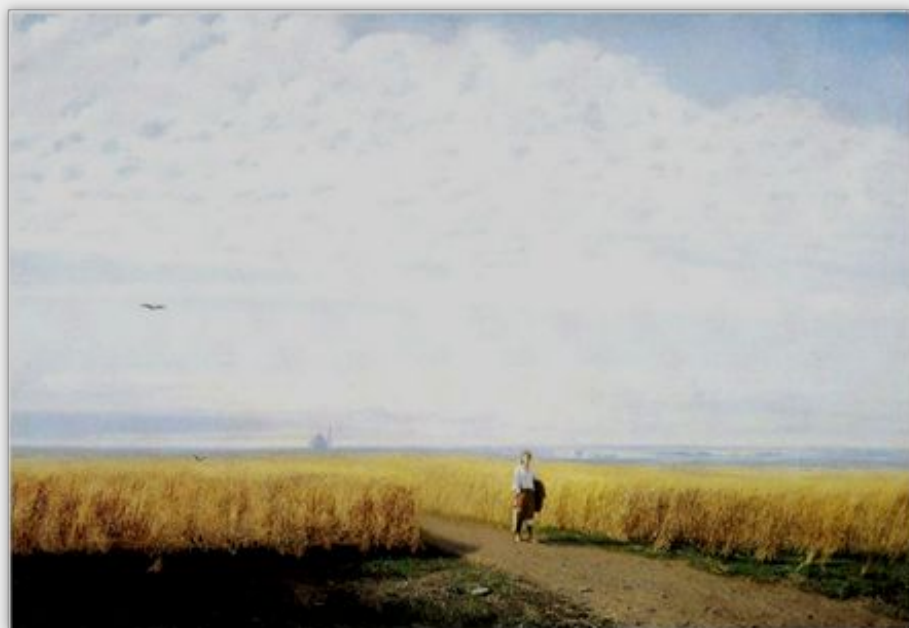
Архип Куинджи Степь