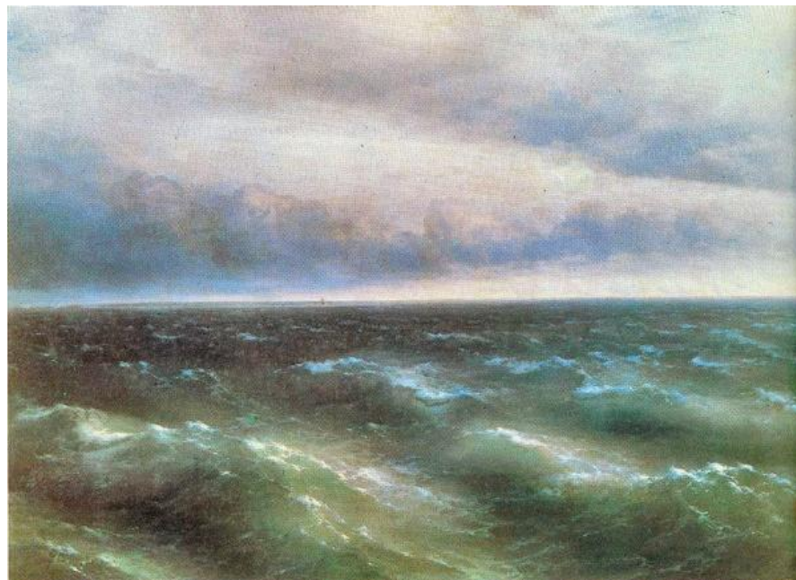
Иван Айвазовский Чёрное море