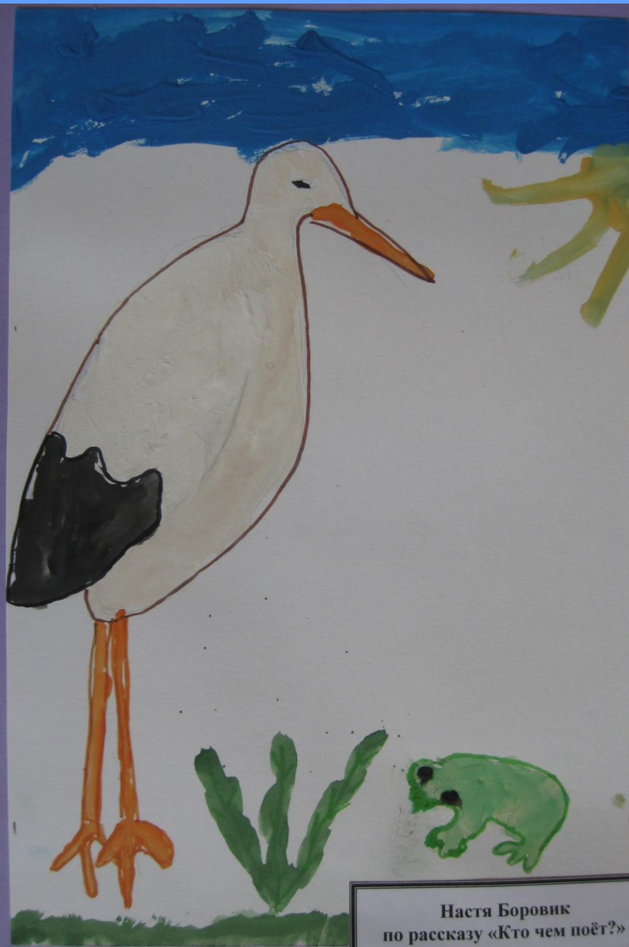
Настя Боровик по рассказу «Кто чем поёт?»