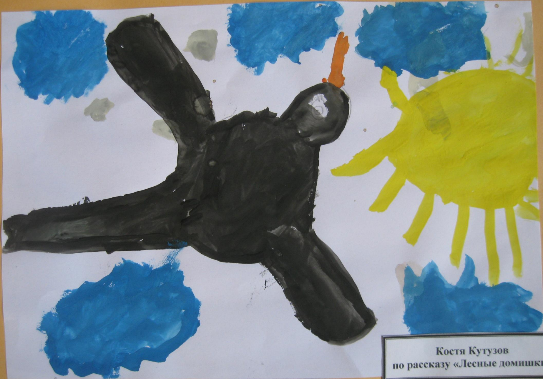
Костя Кутузов по рассказу «Лесные домишки»