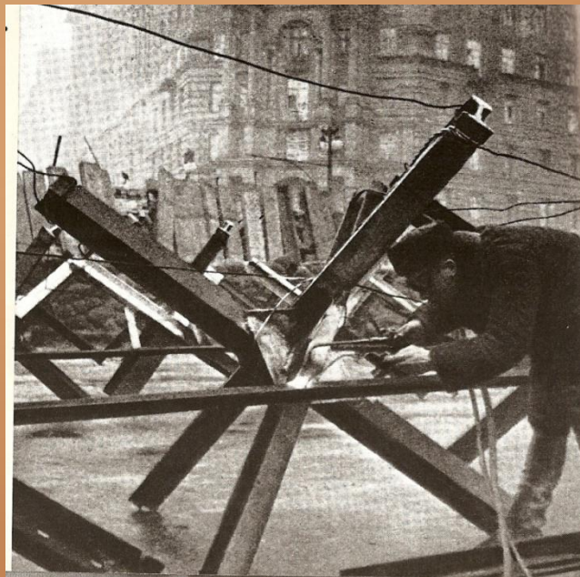
На улицах столицы. Ноябрь 1941г.