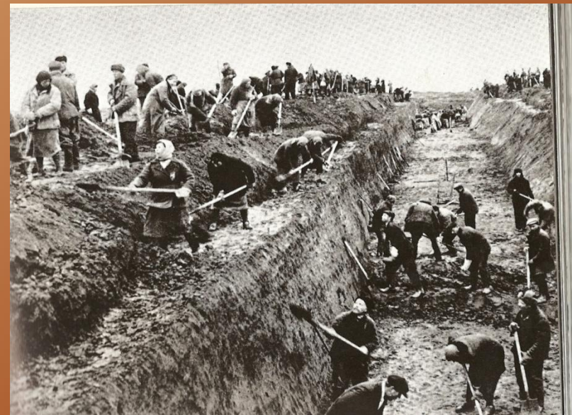
Жители Москвы на строительстве оборонительных рубежей