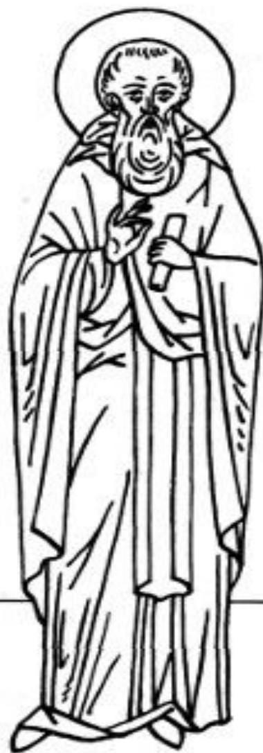
Преподобный Поликарп Брянский