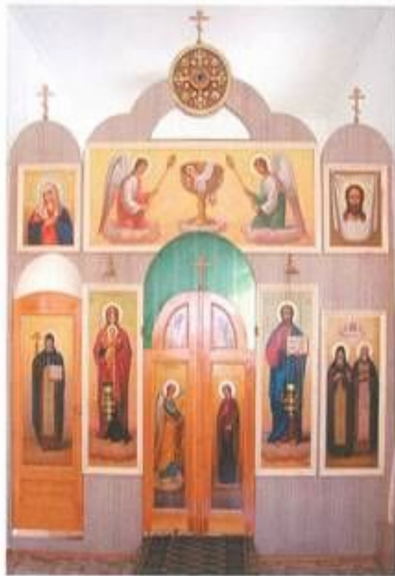
Иконостас придела в честь преподобных князя Олега и Поликарпа Брянских