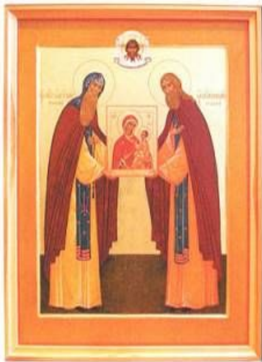
Храмовая икона преподобных князя Олега и Поликарпа Брянских