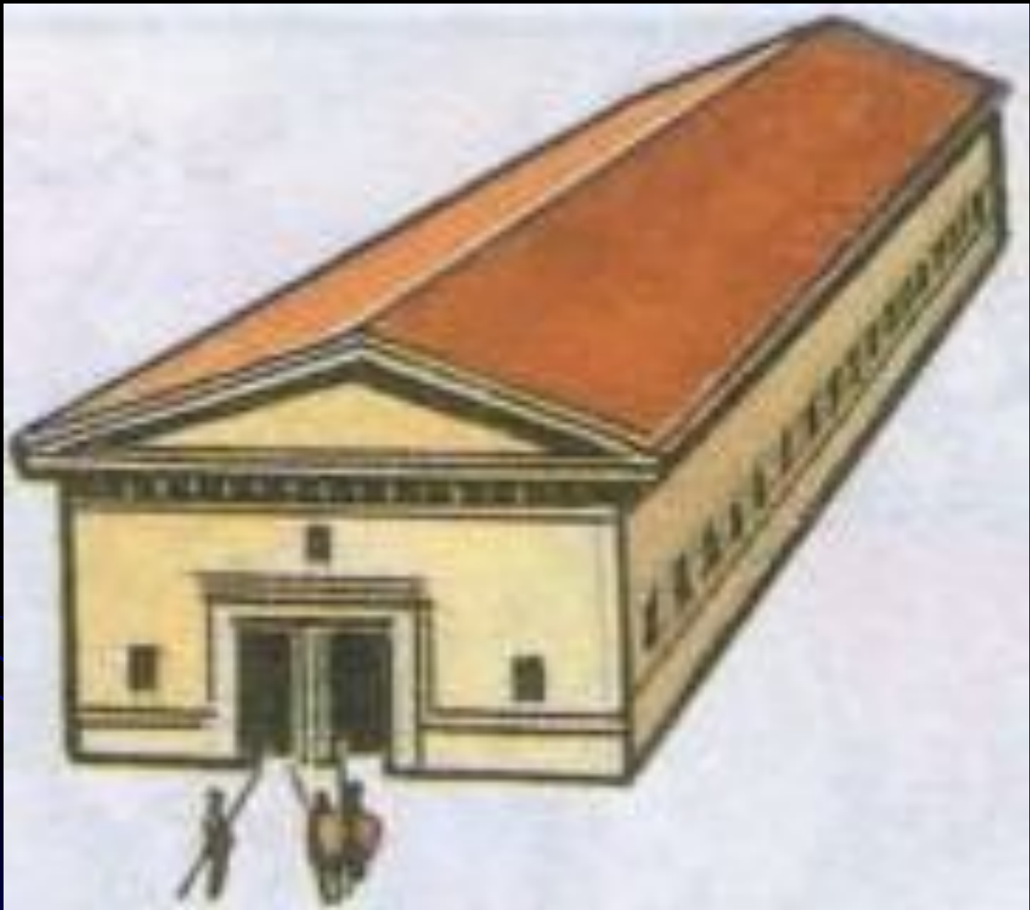
Склад в гавани