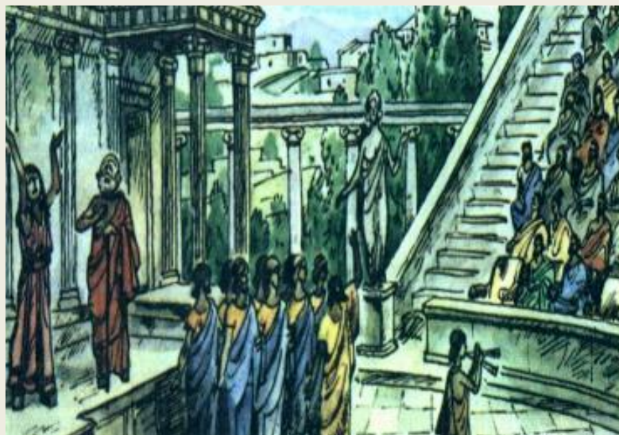
Хор на сцене.

Непременным участником представления был хор, который помогал зрителю следить за сюжетом и давал оценки поступкам героев.