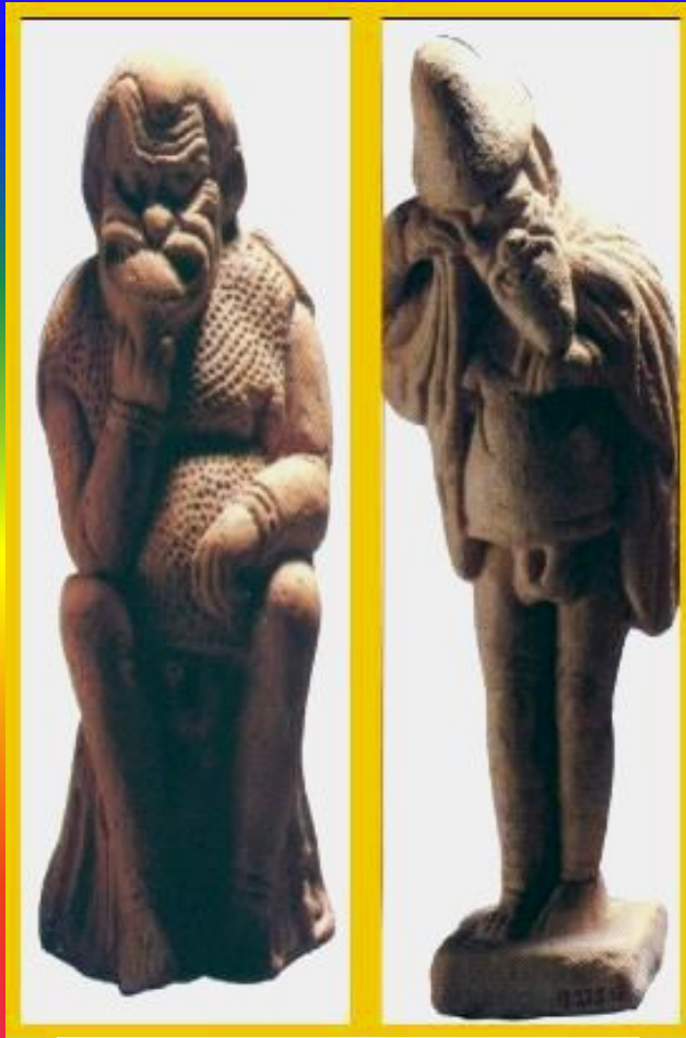
Деревянные статуи Диониса

У истоков греческого театра лежали праздники в честь бога Диониса (Вакха) , покровителя виноделия. Осенью, после уборки винограда, греки одевались в козы и шкуры и маски, изображая лесных богов-сатиров.