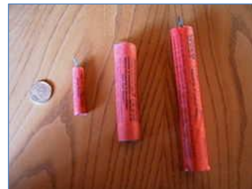
Типичные развлекательные петарды разной мощности