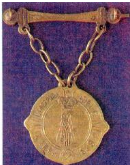
Знак волостного судьи.