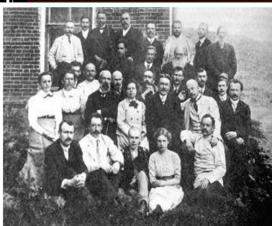
Врачи Земской больницы в Дмитрове.

Непоследовательно выдержан принцип всесословности. Выборы строились по сословному признаку. При этом распределение по куриям давало значительные преимущества дворянам. Вокруг земств сгруппировалась наиболее энергичная, демократически настроенная интеллигенция