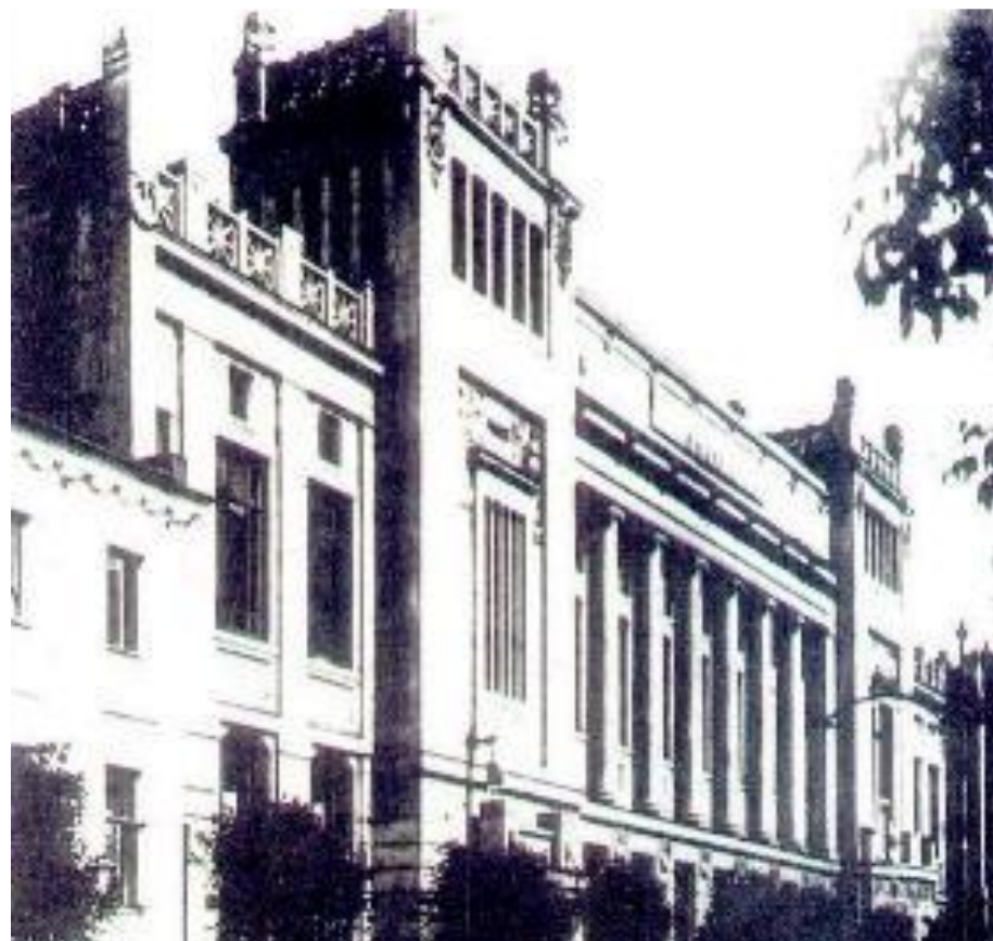
Здание купеческого собрания на Малой Дмитровке.

В 1870 г. была проведена городская реформа, создавшая всесословные городские думы и управы. Избирателями были лица достигшие 25 лет и платившие городские налоги. Они в зависимости от доходов делились на 3 курии, избравшие в городскую думу равное число гласных.