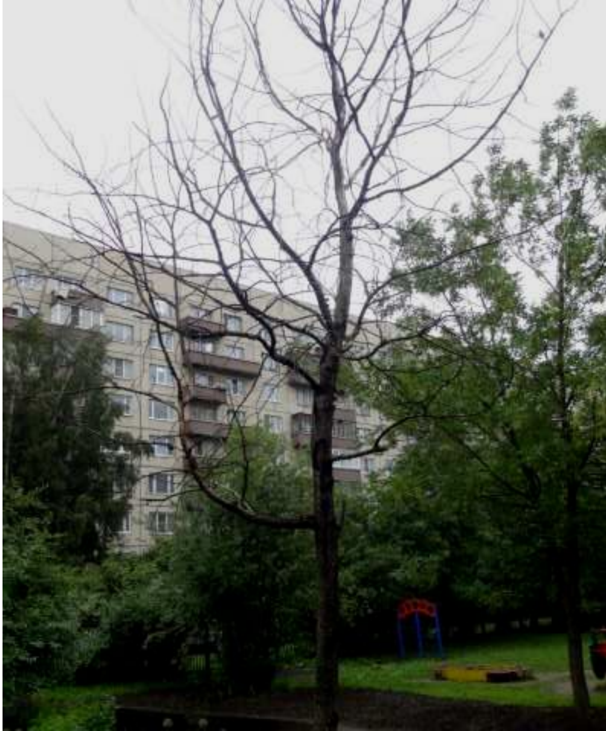
« Засохшее дерево »