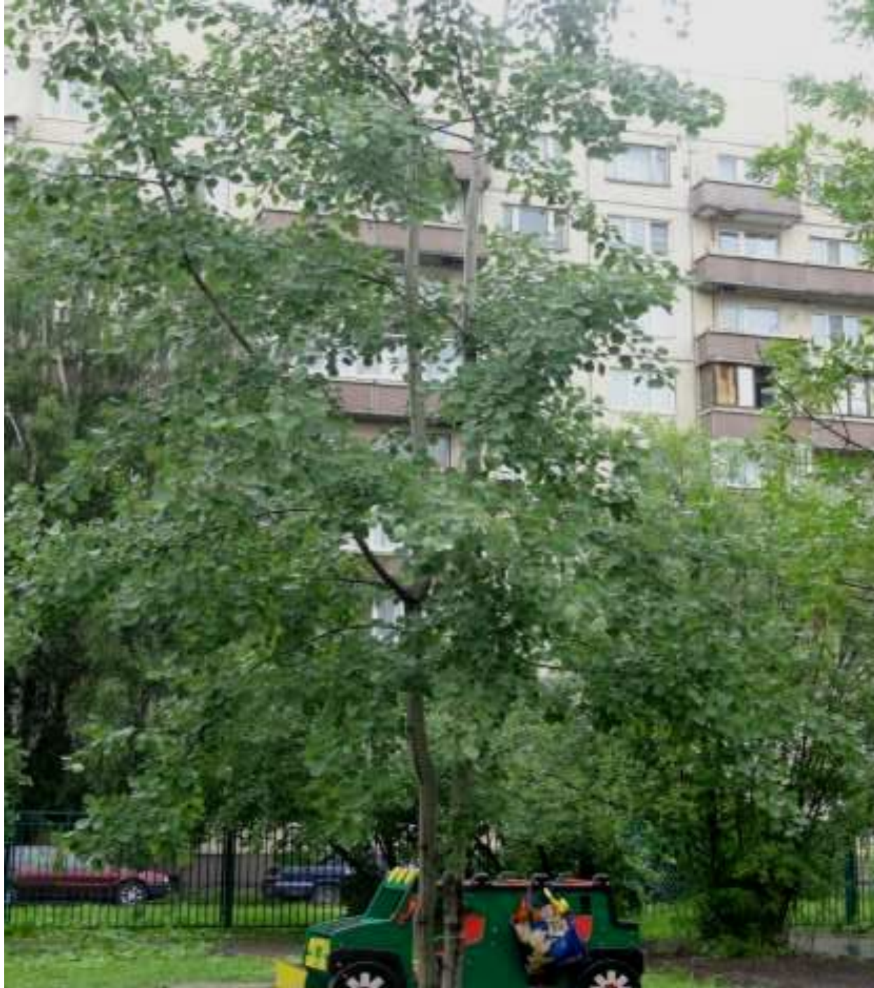
«Осина или дрожащий тополь»