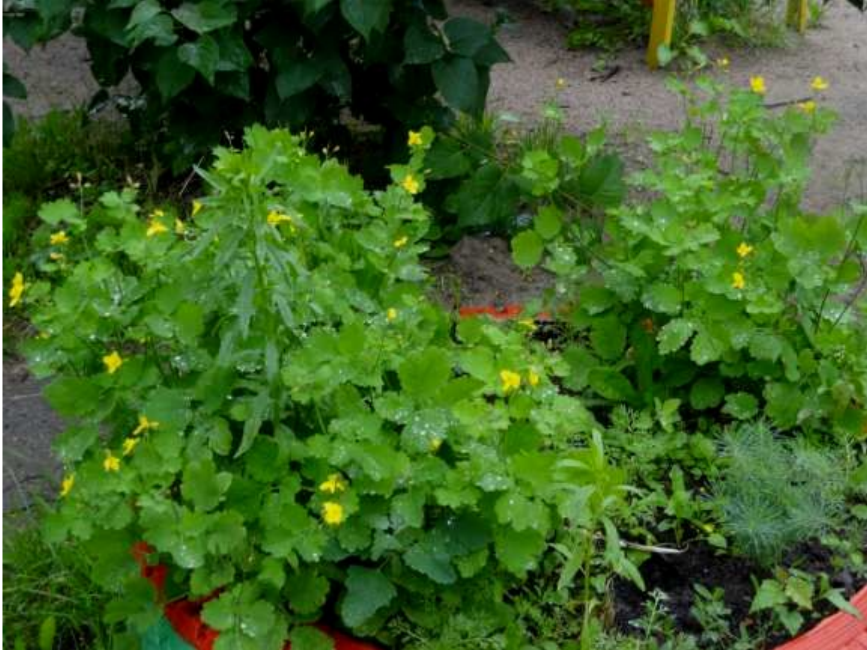
« Лекарственные травы. Чистотел»