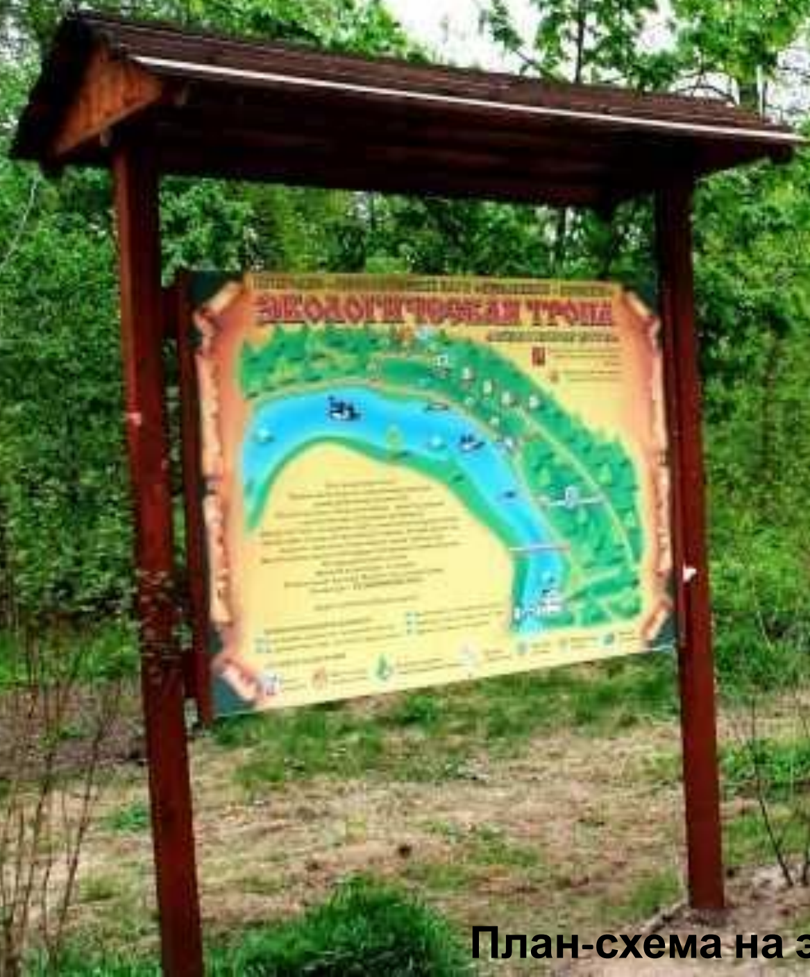
План-схема на экологической тропе