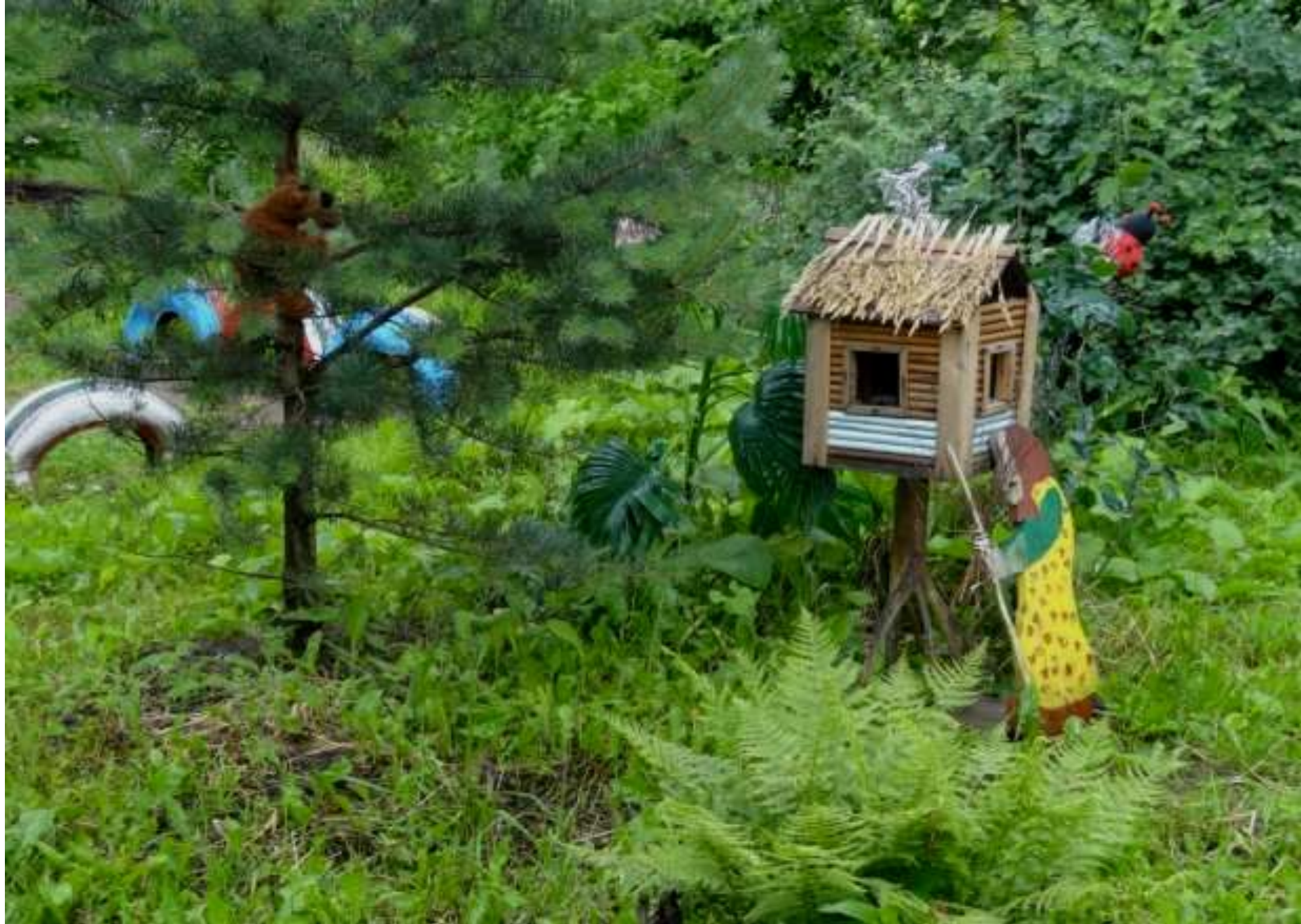
«В гости к Бабе-яге»