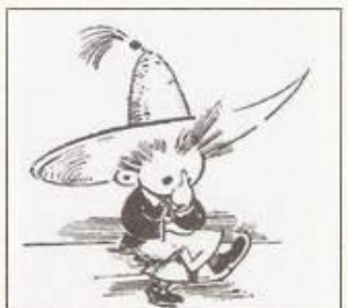
Рис. А. Лаптева «Незнайка думает»