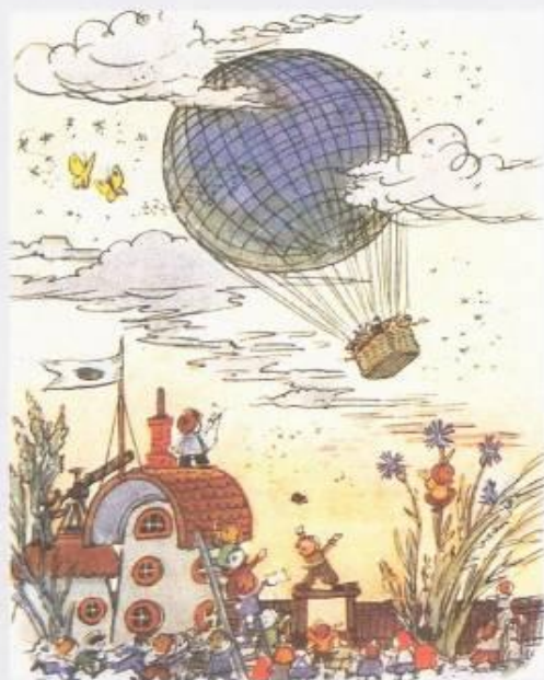
Приключения Незнайки и его друзей. Рисунок А. Лаптева