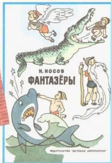
Худ. Г. Вальк