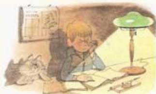
«Витя Малеев в школе и дома». Худ. В. Чижиков

Книги Николая Носова иллюстрировали многие чудесные художники: А. Каневский, И. Семенов, Г. Юдин, В. Лосин, Д. Бисти, Г. Вальк, В. Чижиков и др.