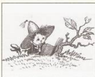
Рис. А. Лаптева «Незнайка читает»