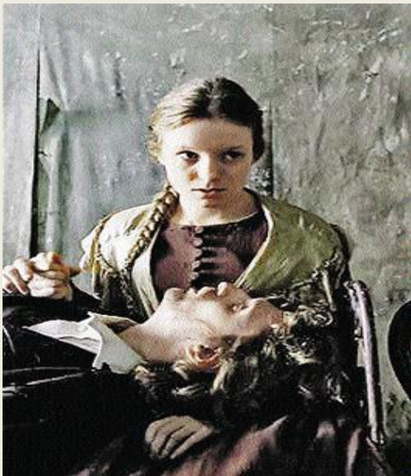
Соня Мармеладов а