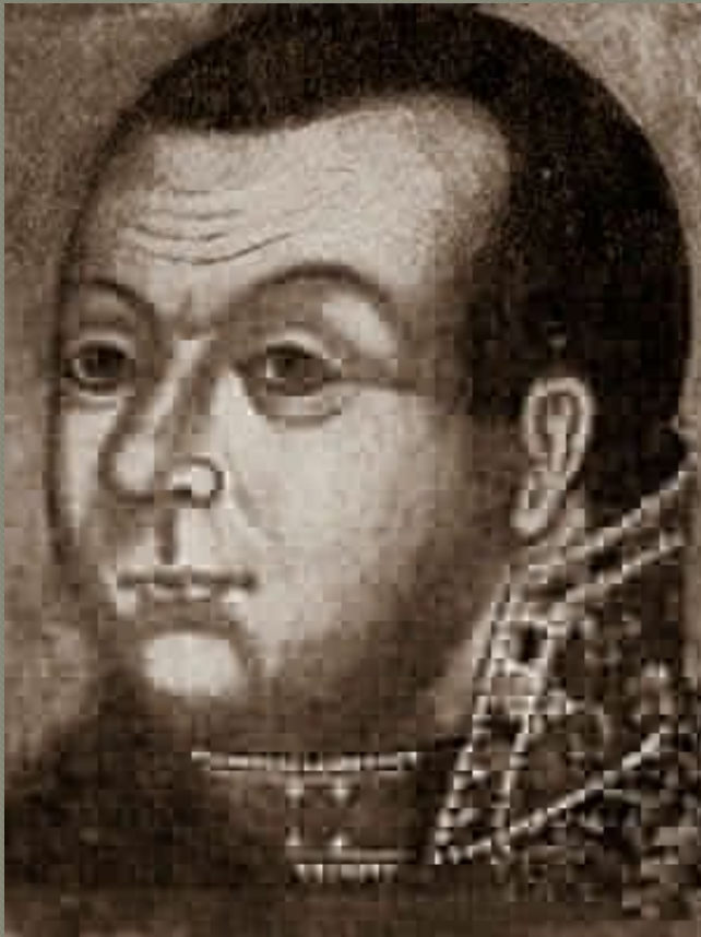
Михаил Скопин- Шуйский