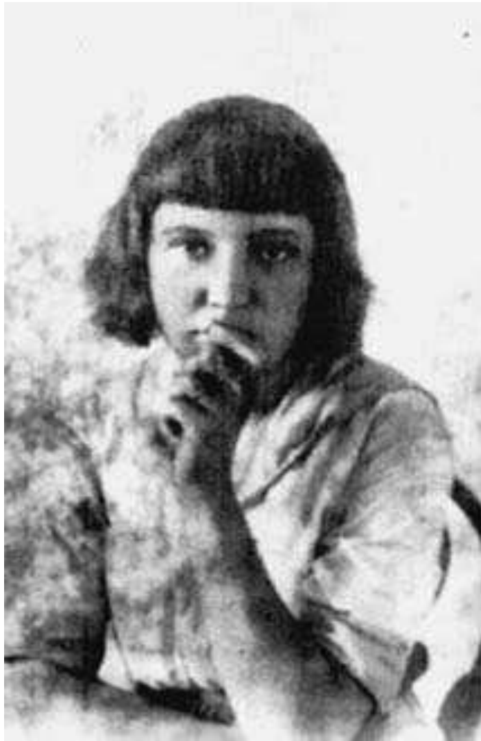
М.Цветаева 1913 г.