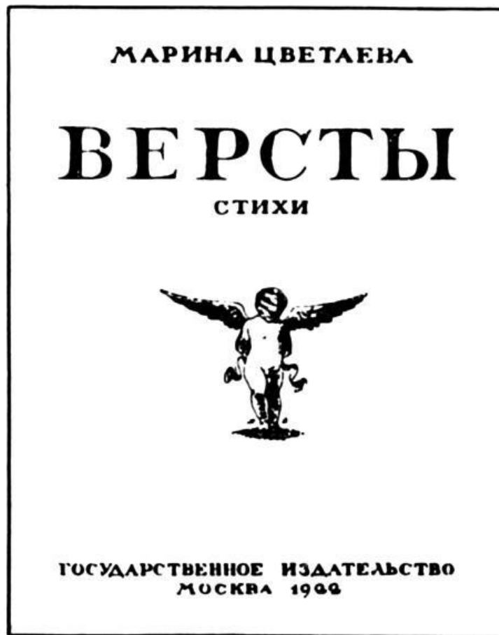
М. И. Цветаева. «Версты». Обложка работы Н. Н. Вышеславцева