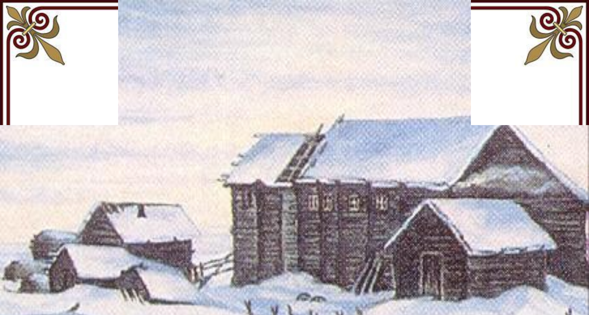
Деревня, в которой родился М.В.Ломоносов. По рисунку XIX в.