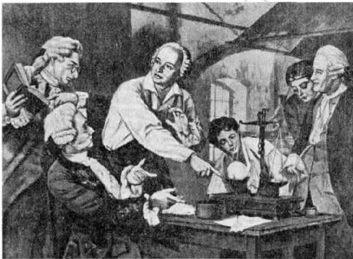
Ломоносов в химической лаборатории. Линогравюра Н. Г. Наговицына.