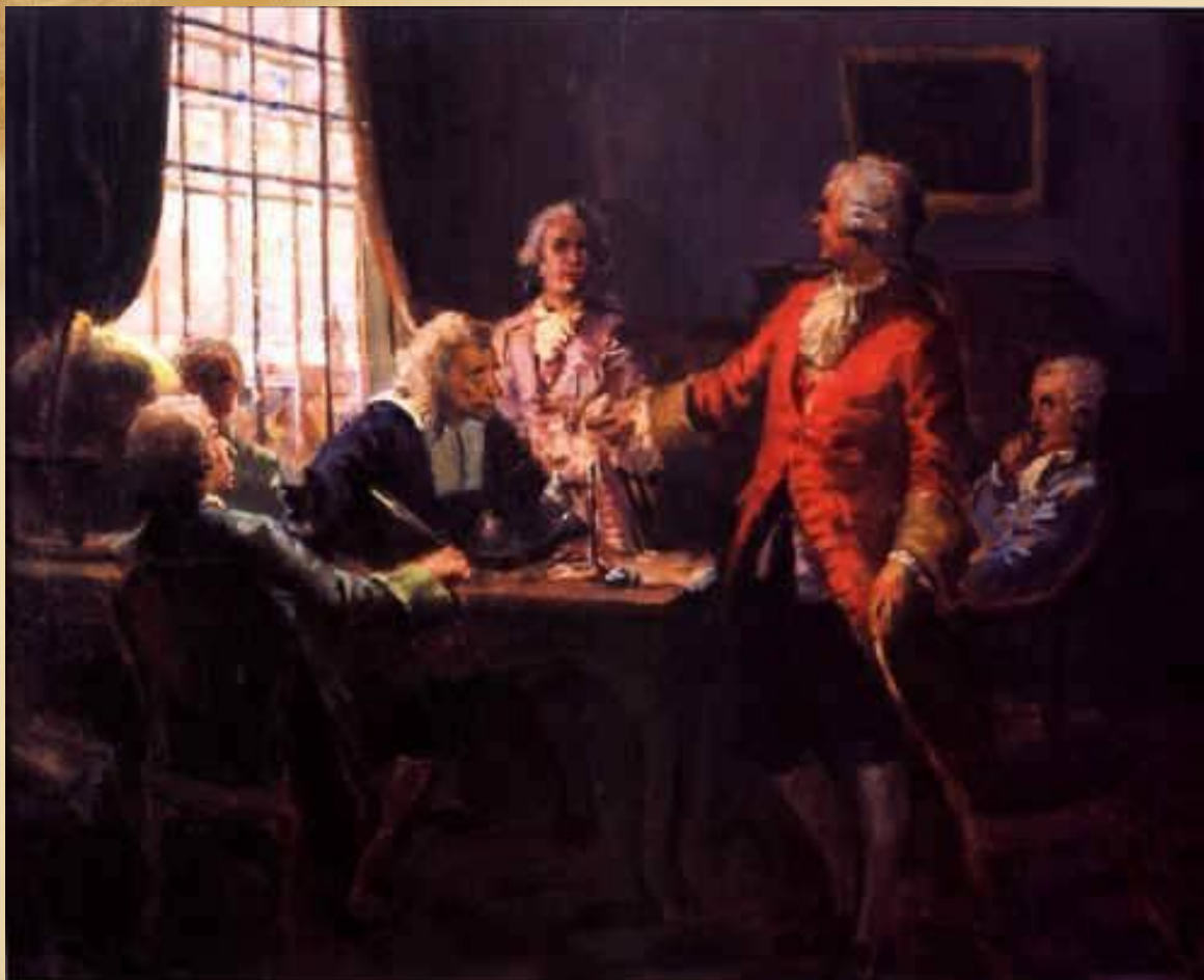
Ломоносов в Германии. Ученый диспут.