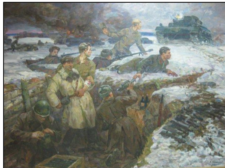
Картина "Подвиг 28 героев Панфиловцев" в Музее героев Панфиловцев