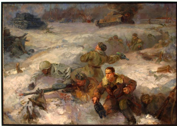
Подвиг 28-и героев-панфиловцев Е.И. Комаров, 1942