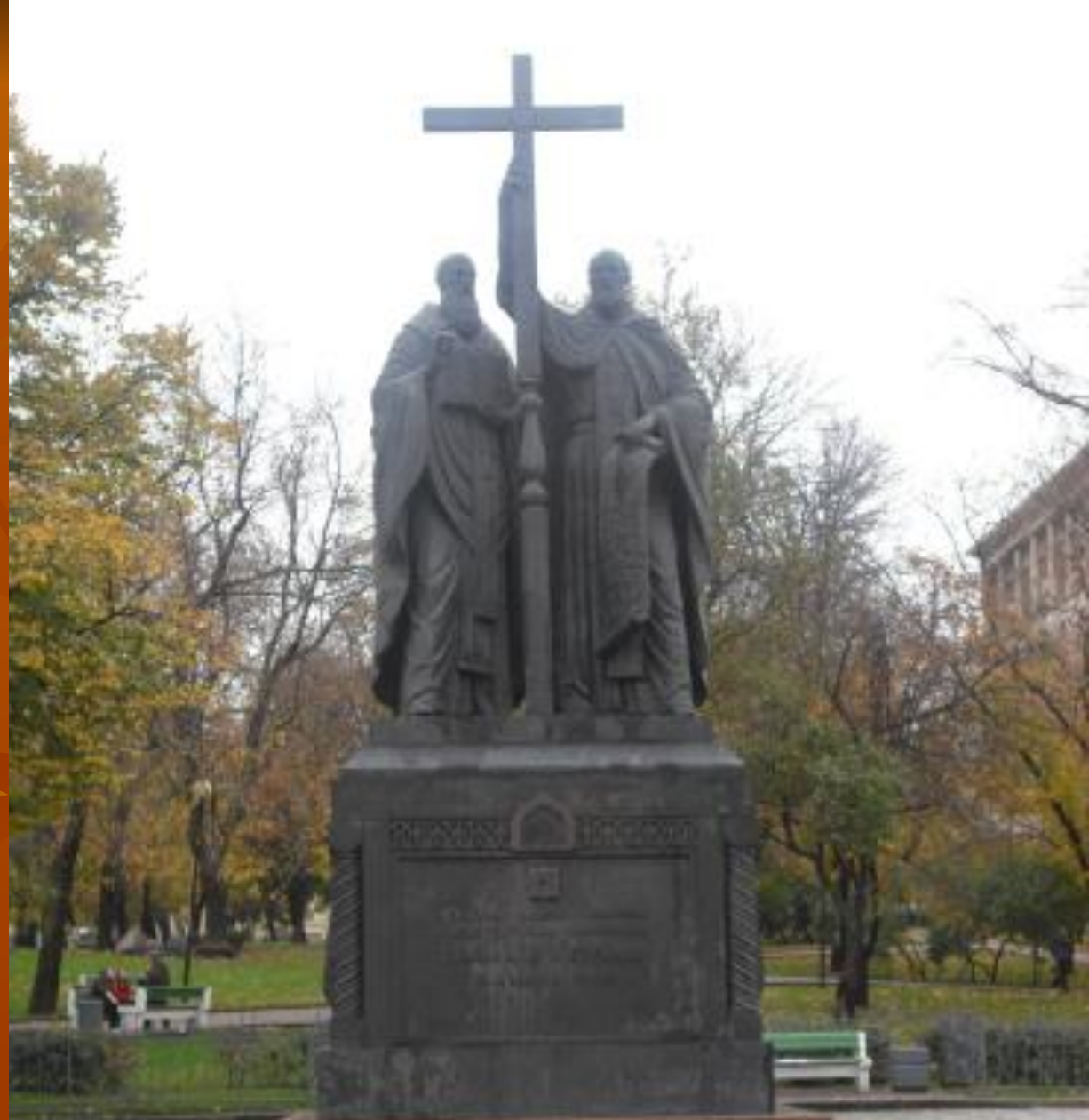
Памятник Кириллу и Мефодию

На празднике звучит гимн, сочиненный болгарским композитором специально для этого дня.