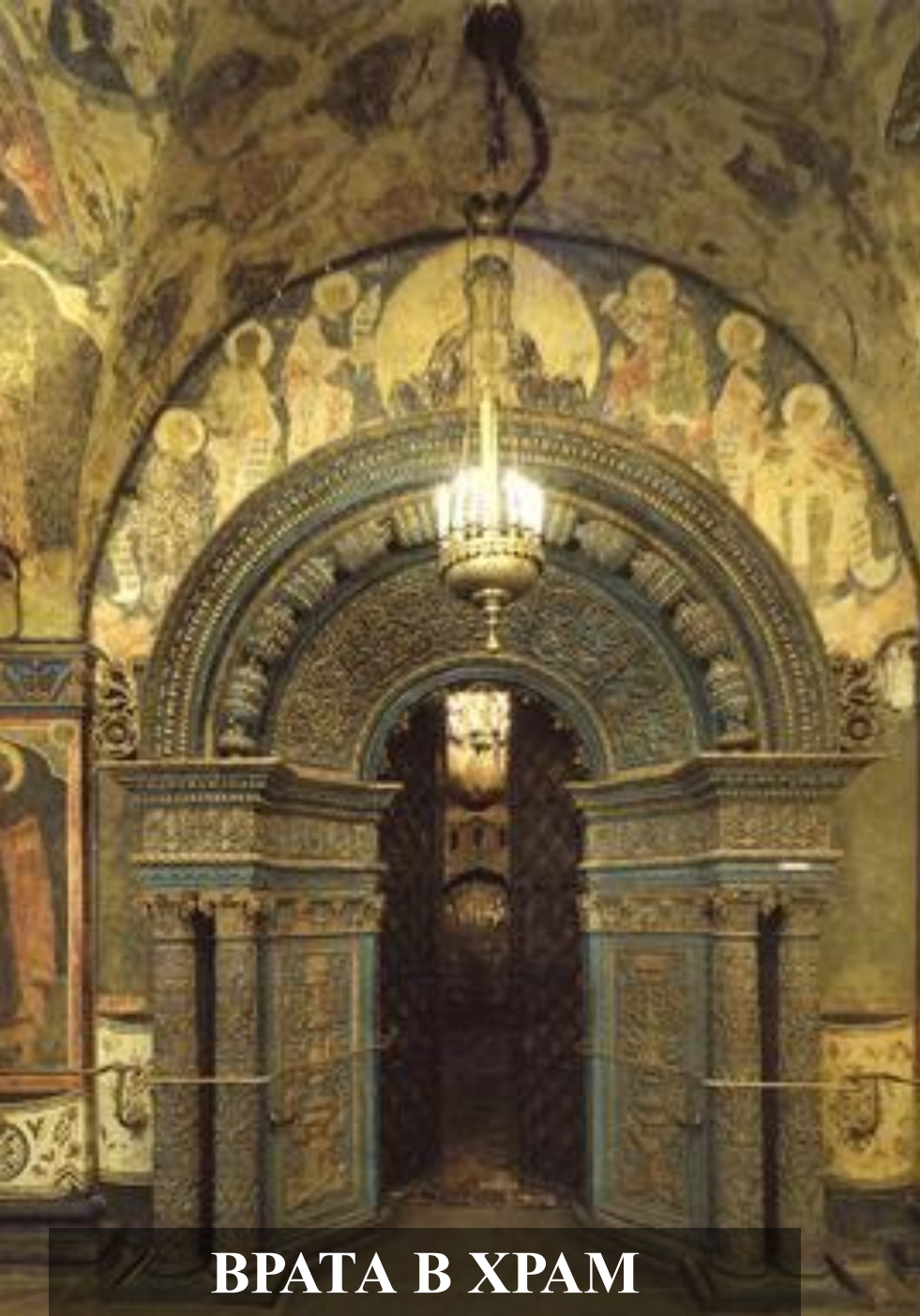
ВРАТА В ХРАМ

Вот уже две тысячи лет воспевается образ Божией матери. Богородице посвящают свои творения художники и скульпторы, поэты и композиторы. Недаром среди многих обращений к Богородице - Дева Мария, Царица Небесная, Мадонна - есть обращение - Всепетая.