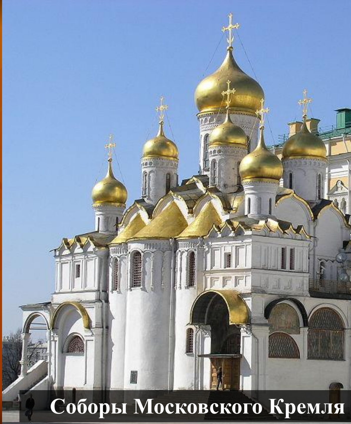
Соборы Московского Кремля

Колокольный звон сопровождал человека от рождения до смерти – во времена великих праздников и событий, в моменты радости и горя.