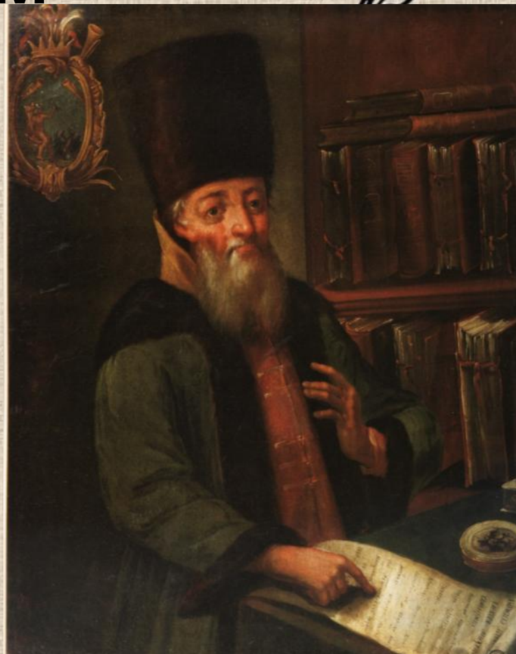
Инициатор принятия Новоторгового Устава А.Л. Ордин-Нащокин