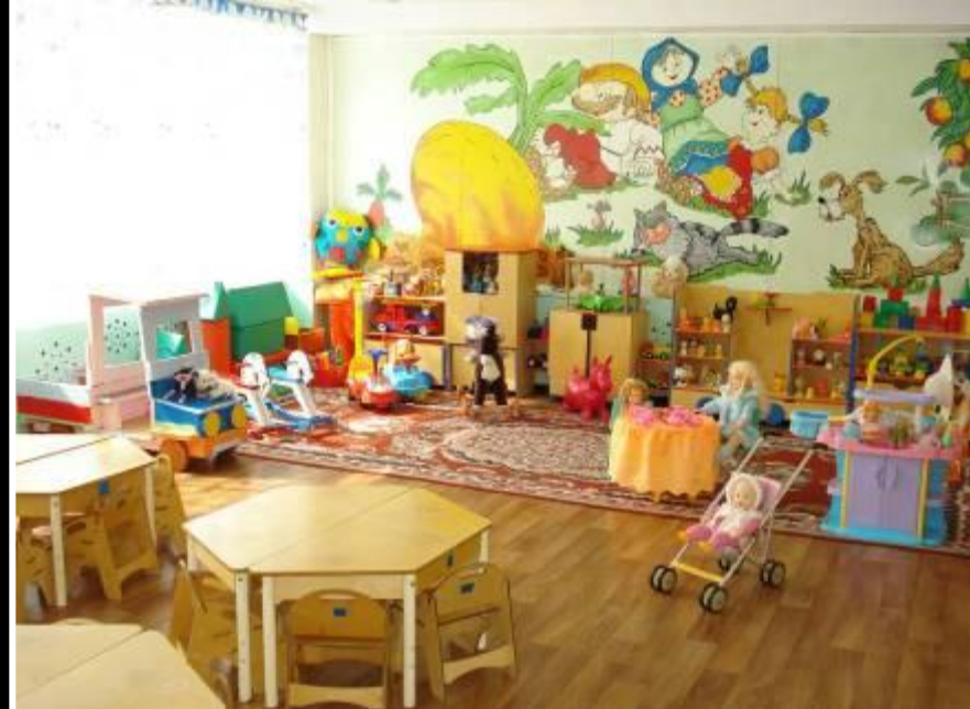
1 младшая группа «Малышок»