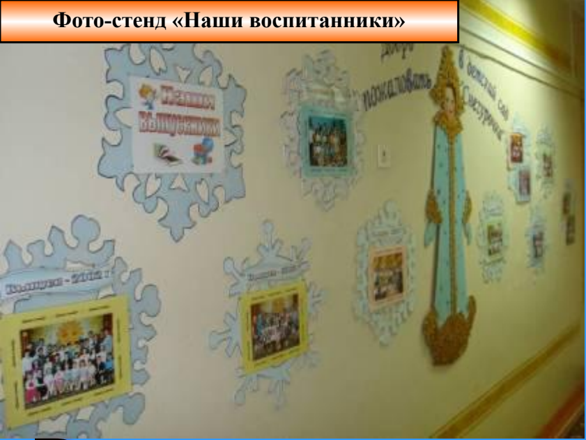
Фото-стенд «Наши воспитанники»