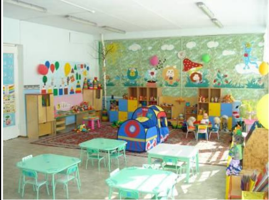
Группа раннего возраста «Кроха»