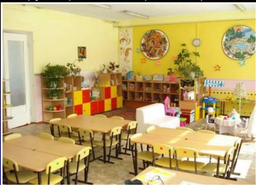
2 младшая группа «Елочка»