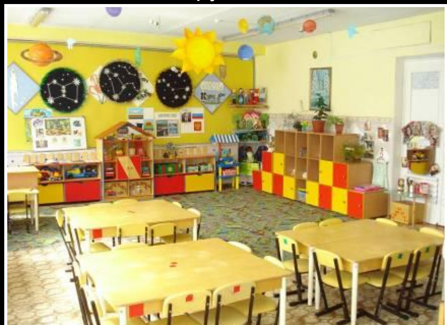
Средняя группа «Снежинка»