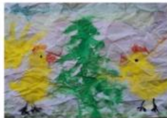
Цыплята у ёлки