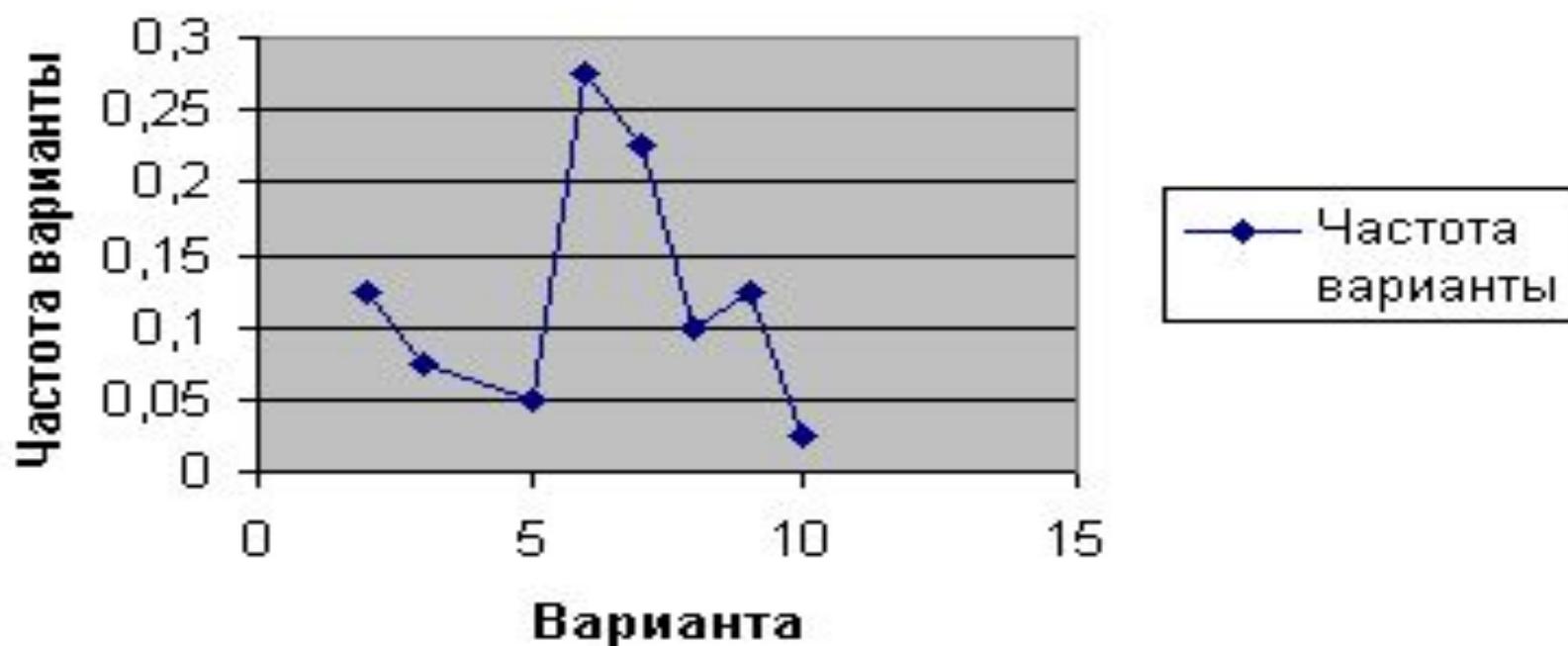
Многоугольник распределения частот