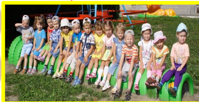
Вас приветствует 2-я младшая группа