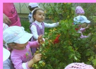
на ягодной полянке