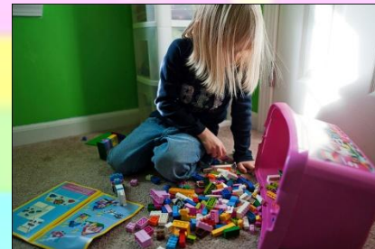
play a game