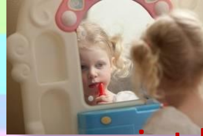
paint her face