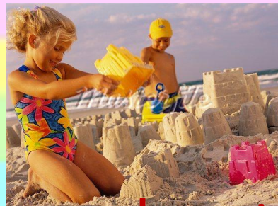
make a sand castle