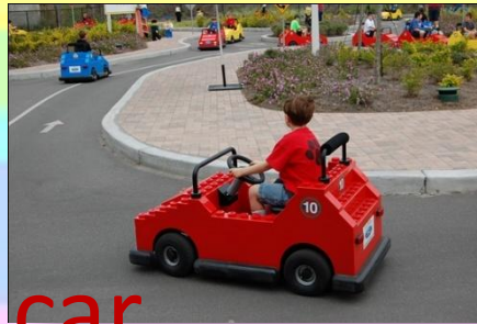
drive a car