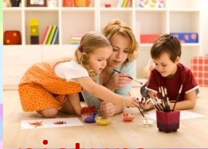
paint a picture