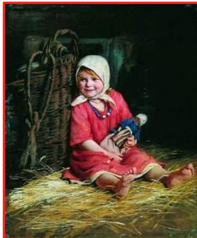
К. Лемох, "Варька"