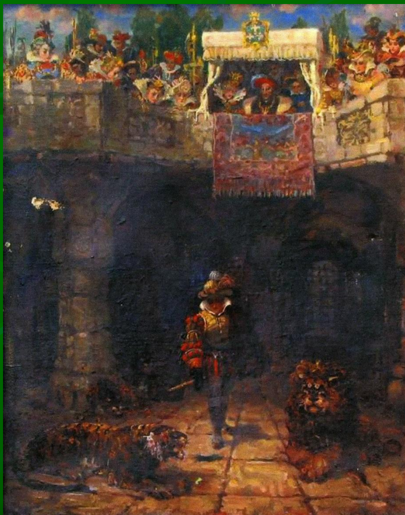
Иллюстрация к балладе Ф.Шиллера «Перчатка» Мазеля (Рувима) Ильи Моисеевича (1946 Г. Холст, масло)