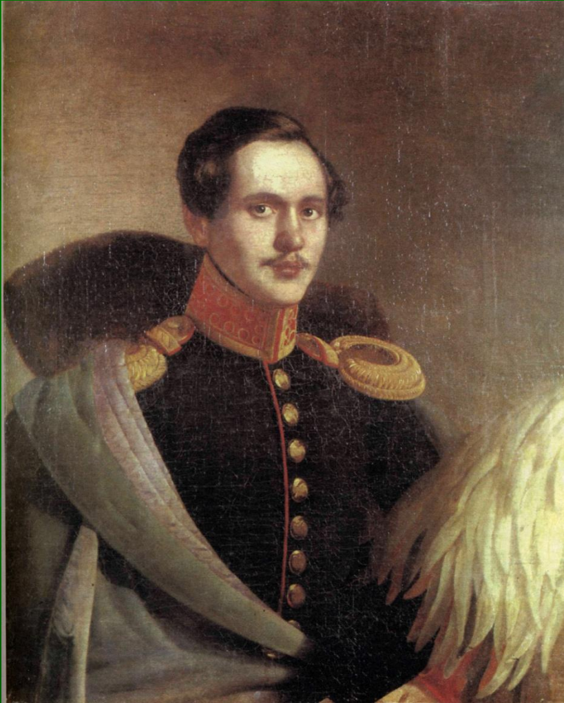
М. Ю. Лермонтов в вицмундире лейб-гвардии Гусарского полка. Портрет работы Ф. О. Будкина. Масло, 1834.