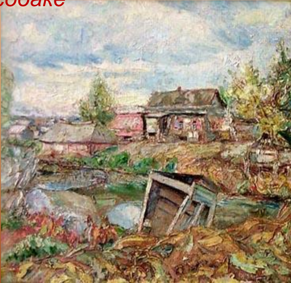
Художник Давид Бурлюк

...она никому не принадлежала у неё не было собственного имени