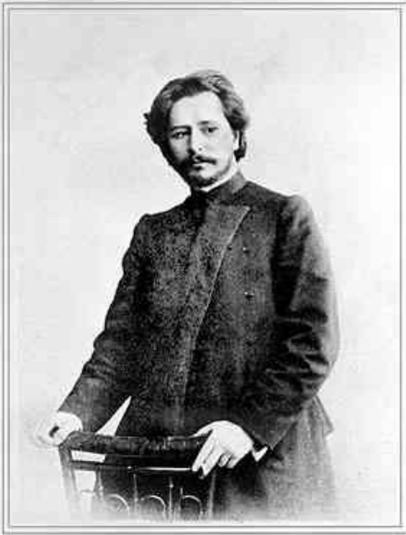
Л. Н. АНДРЕЕВЪ.