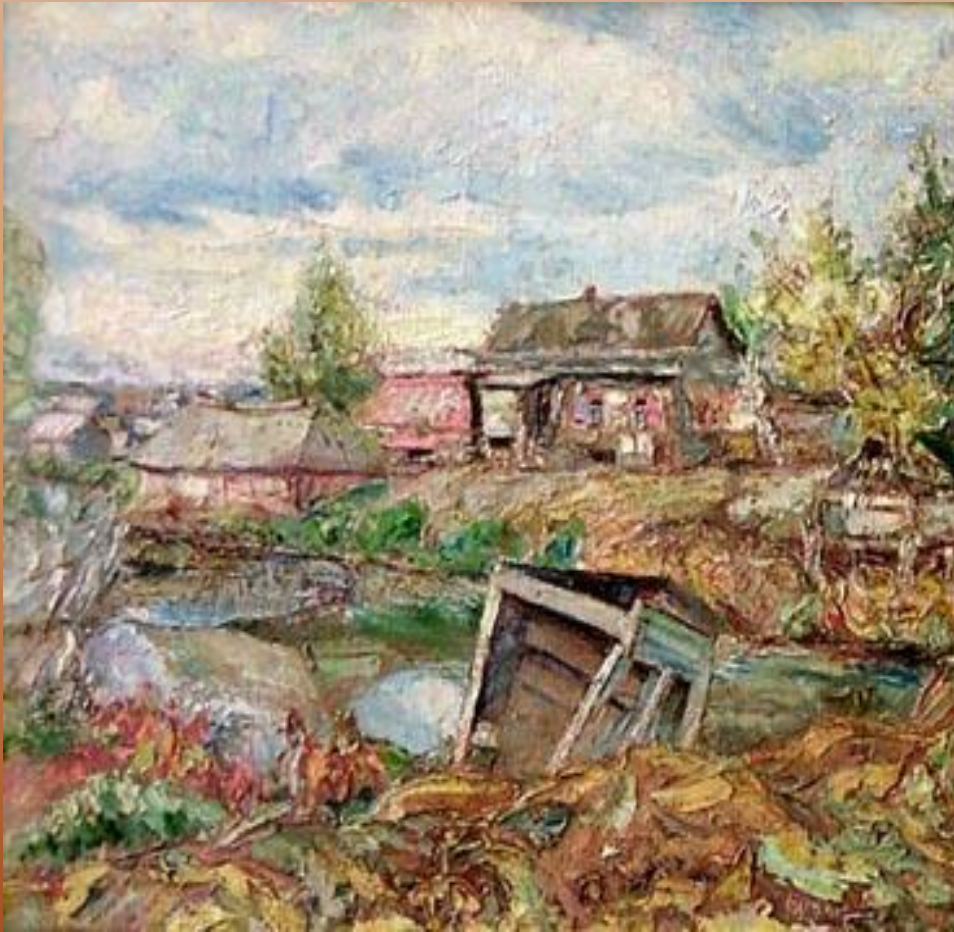
Художник Давид Бурлюк

только один раз её пожалели и приласкали пропойца -мужик, возвращавшийся из кабака, позвал, а потом с размаху ткнул её в бок носком тяжёлого сапога